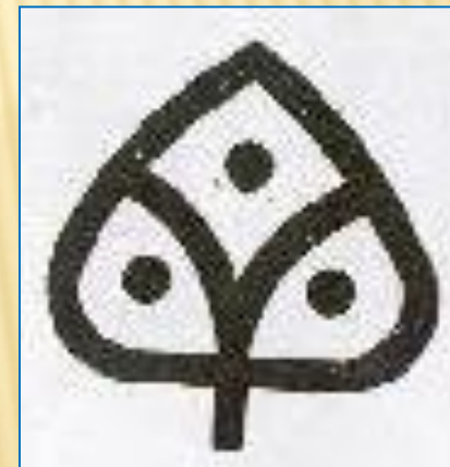
Южноуральский фарфоровый завод