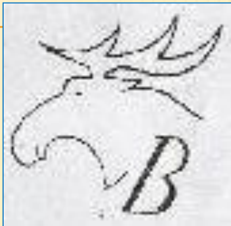
Дмитровский фарфоровый завод