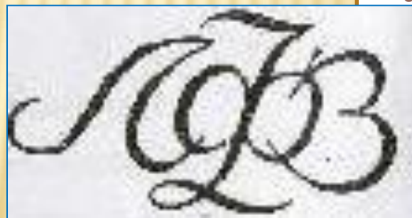
Ленинградский фарфоровый завод