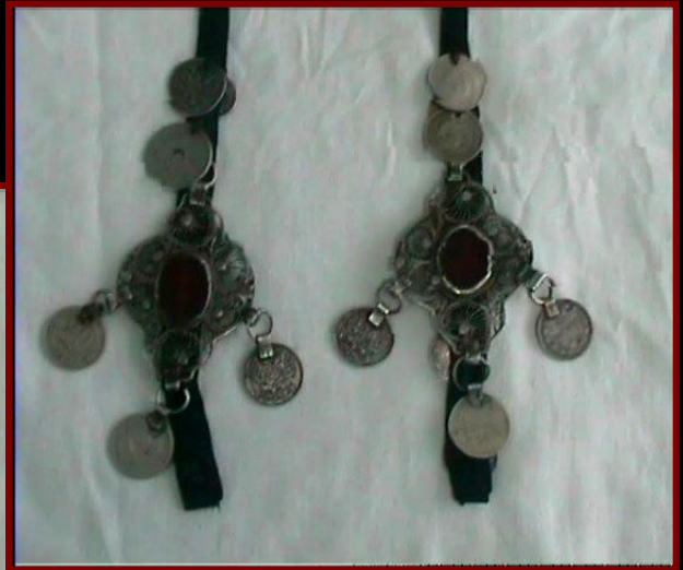
Чылбыр (Украшение для волос)