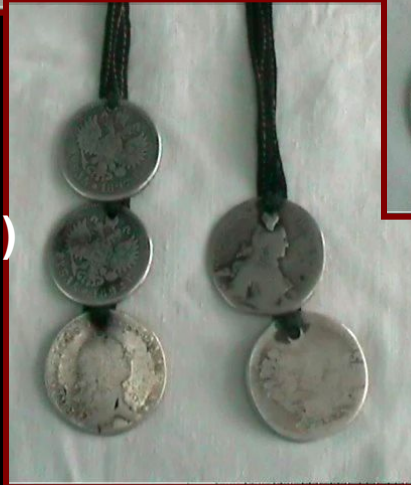
Быдэс (Украшение для волос)