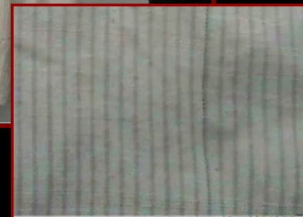
Женская повседневная верхняя одежда - зыбын