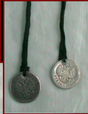
Быдэс (Украшение для волос)