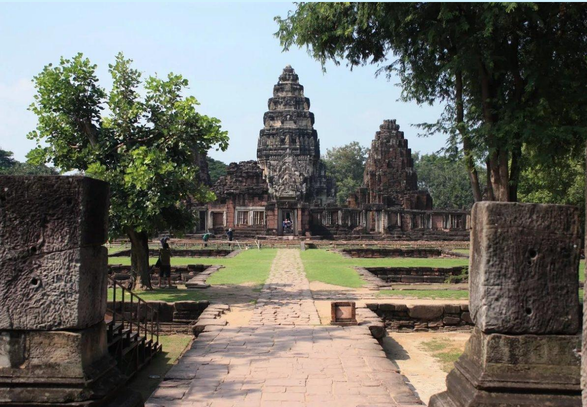
Исторический парк в Тайланде