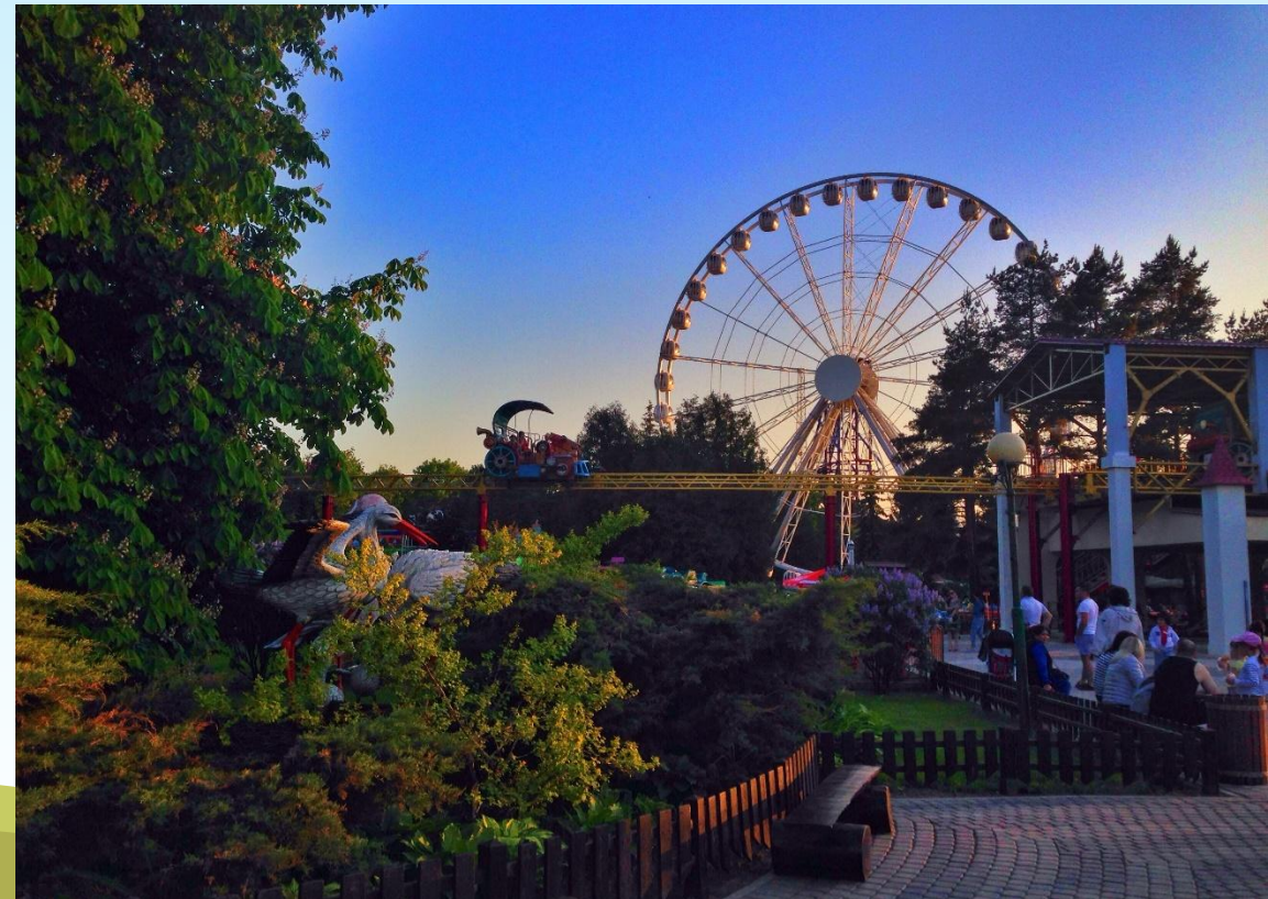
Диво - остров