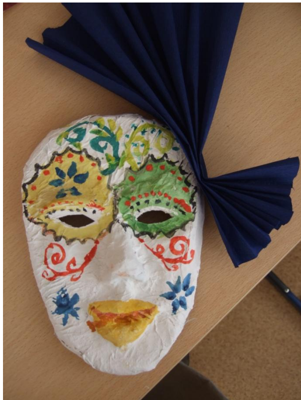
Работы учеников 6 класса