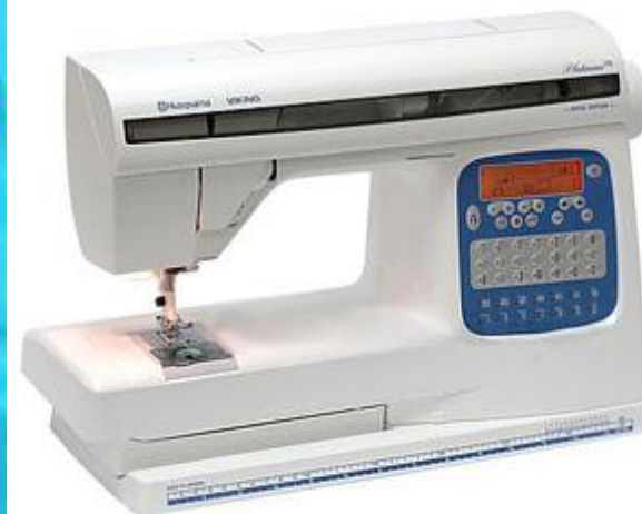
Швейная машина с электроприводом