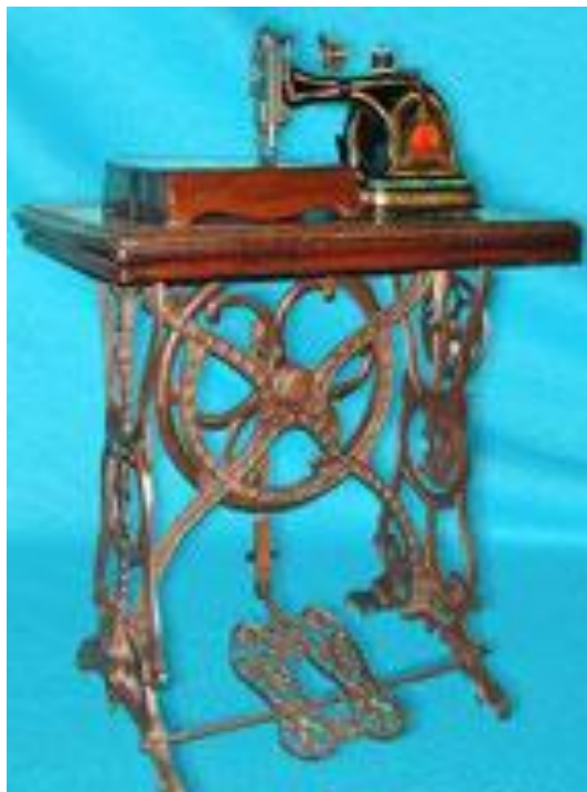
Швейная машина с ножным приводом