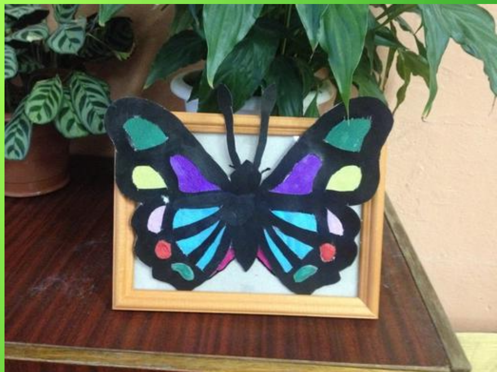
Витраж из бумаги