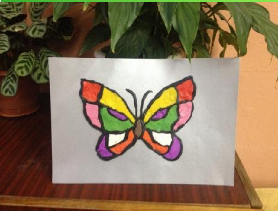
Обратный витраж из пластилина