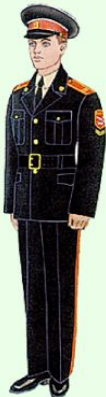
Летняя парадная для строя