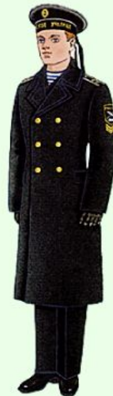
Зимняя парадная вне строя