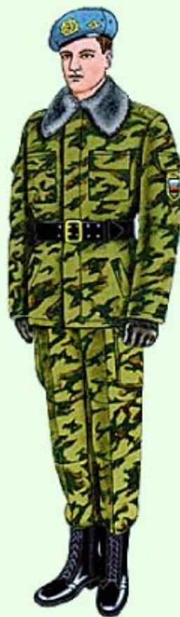
Парадная для строя в ВДВ