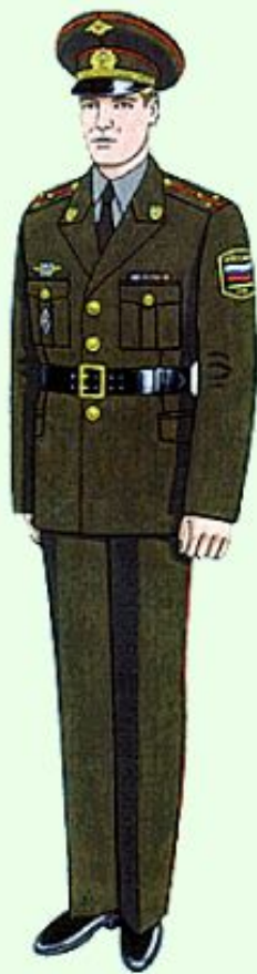
Повседневная для строя