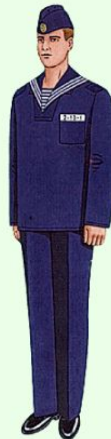
Повседневная для строя и вне строя