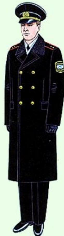
Парадная для строя и вне строя в береговых войсках