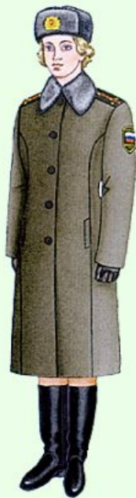
Зимняя повседневная вне строя (кроме ВМФ)