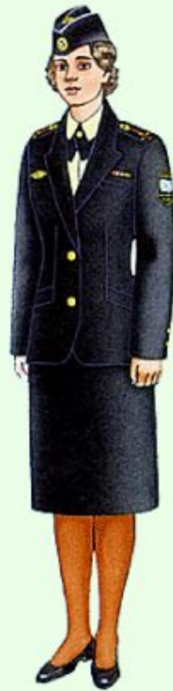
Летняя повседневная вне строя в ВМФ