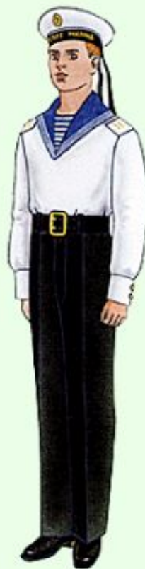
Летняя парадная для строя и вне строя