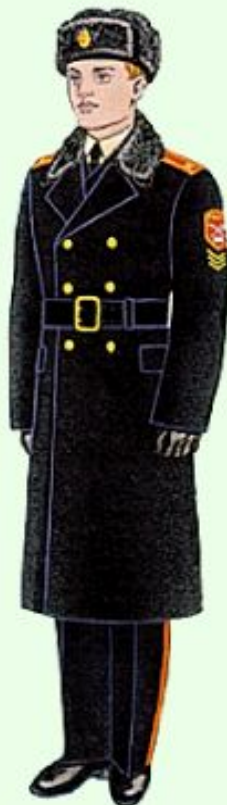
Зимняя парадная для строя