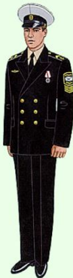
Парадная вне строя курсантов