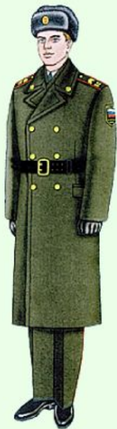
Парадная для строя