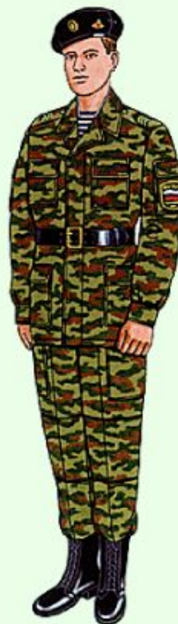
Повседневная для строя и вне строя в береговых войсках