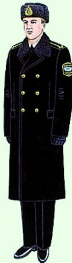
Повседневная для строя и вне строя