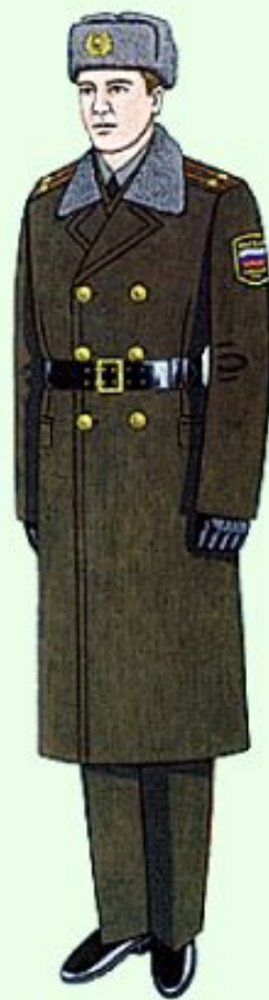
Повседневная для строя