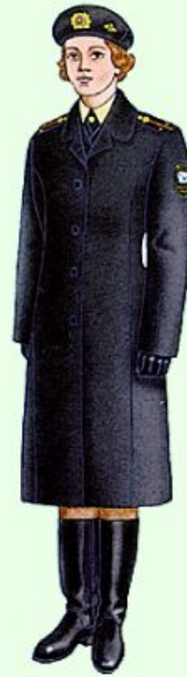
Зимняя повседневная вне строя в береговых войсках ВМФ