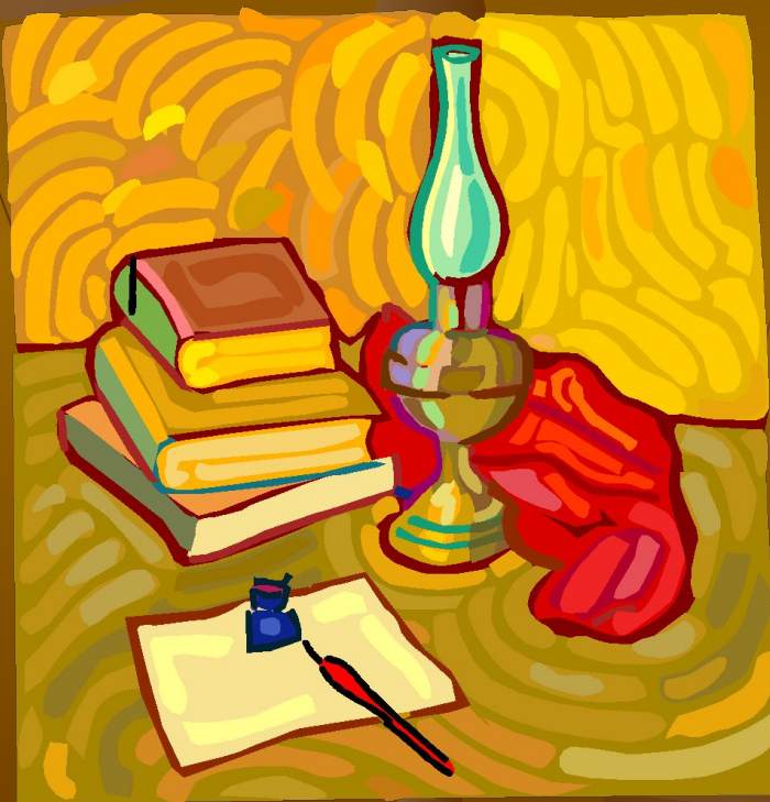
Рисунок для вышивки