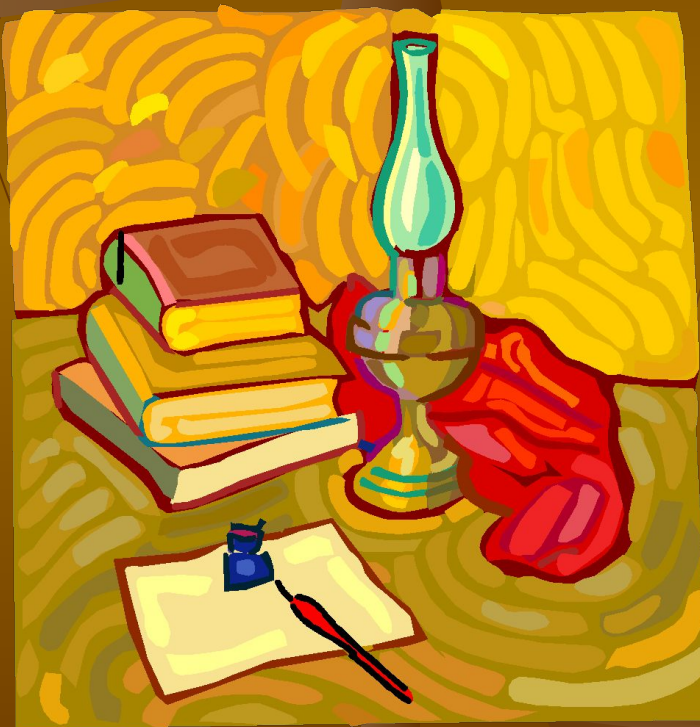
Рисунок для вышивки