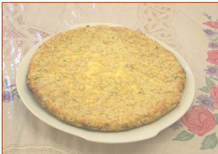
7кл «Королевская ватрушка»