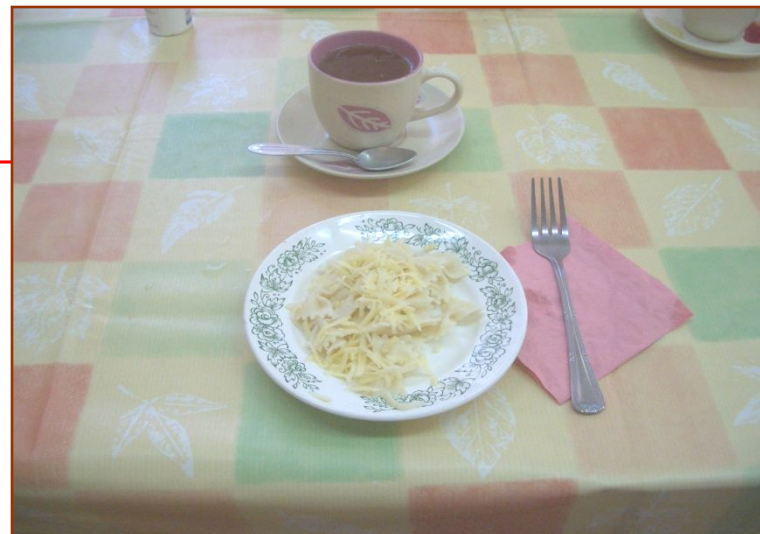
Макароны с сыром