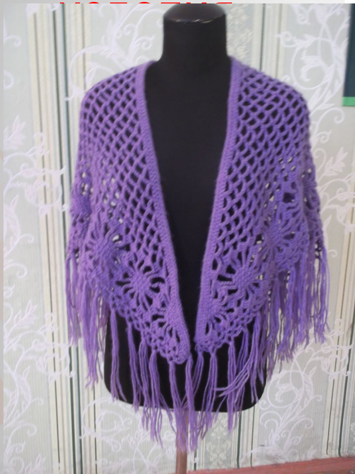
Схема и фотография