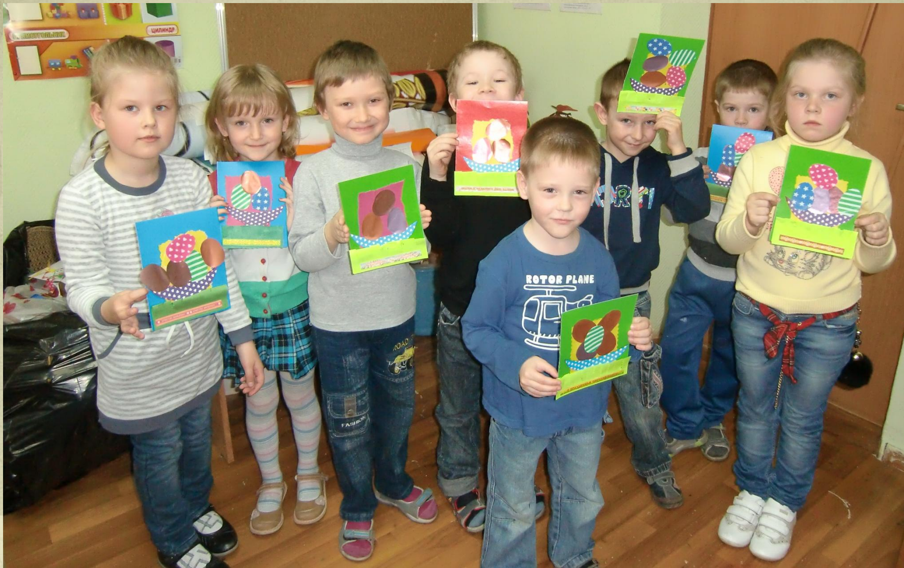
2 группа, возраст 5-6 лет