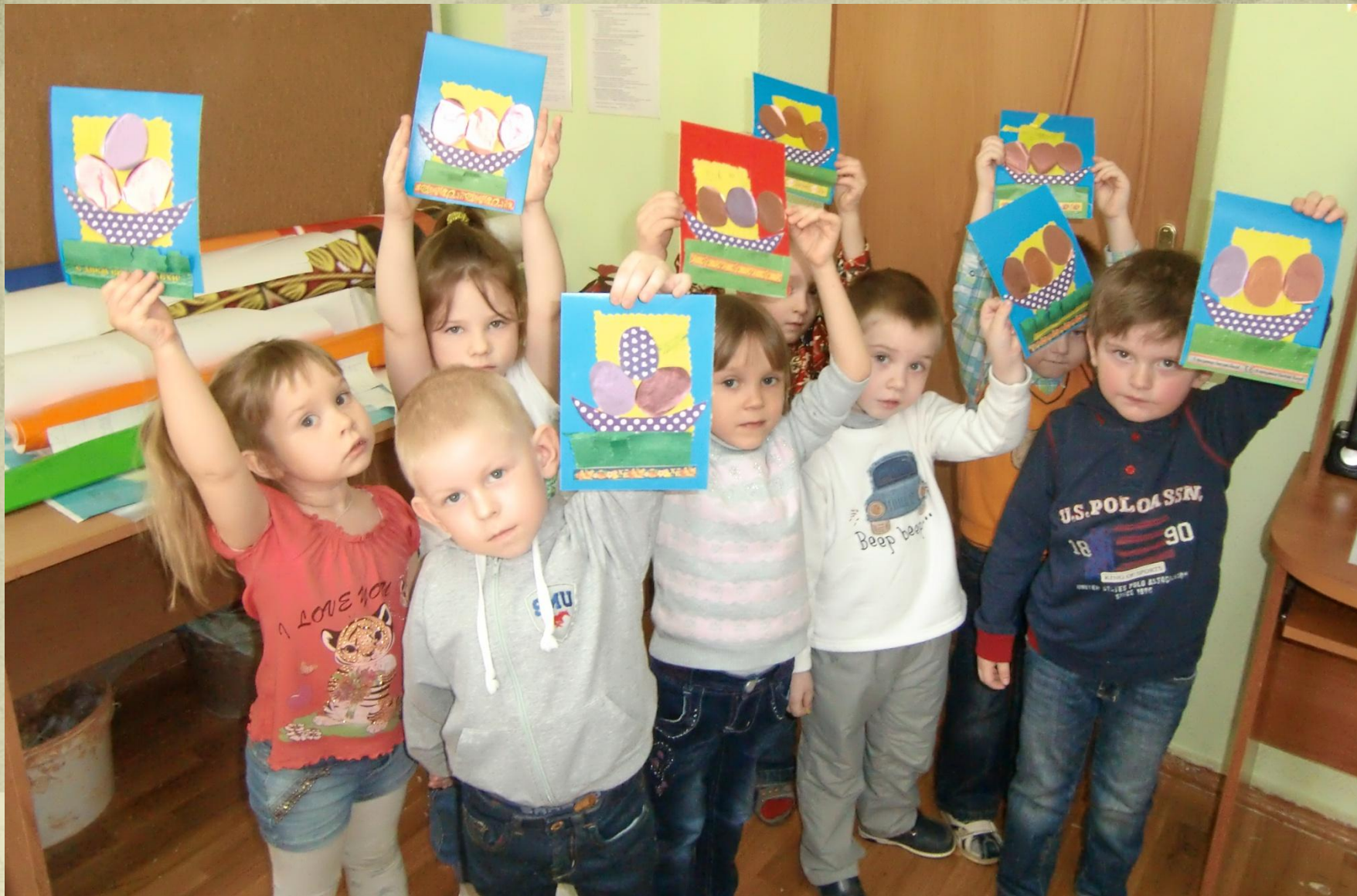
1 группа, возраст 4- 5 лет