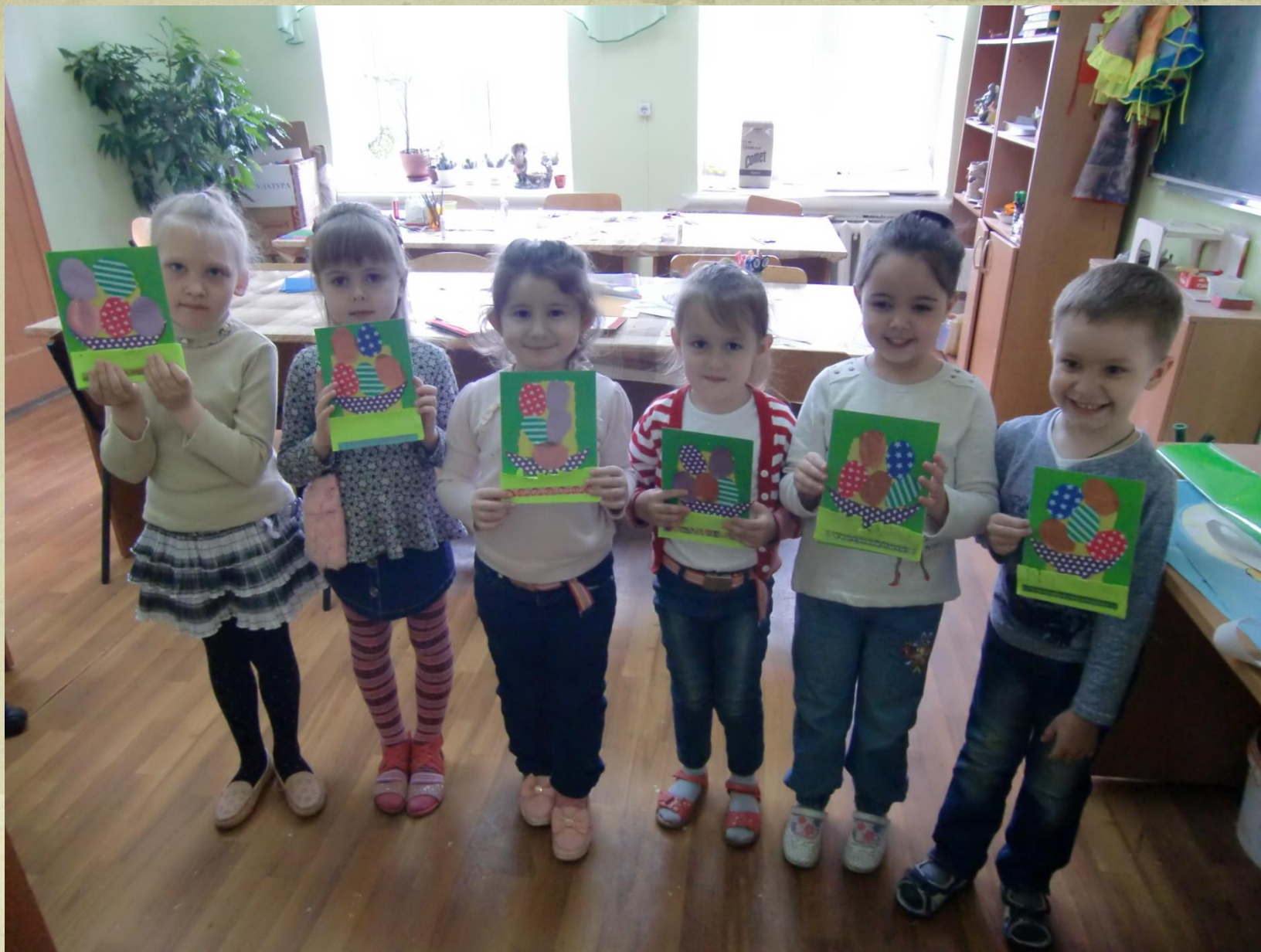
3 группа, возраст 6-7 лет