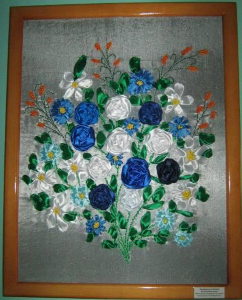
Embroidery of a bouquet of flowers by the artist [Name] in 1950s [Additional text]