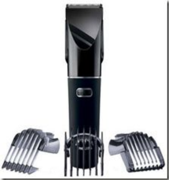
машинка для стрижки волос