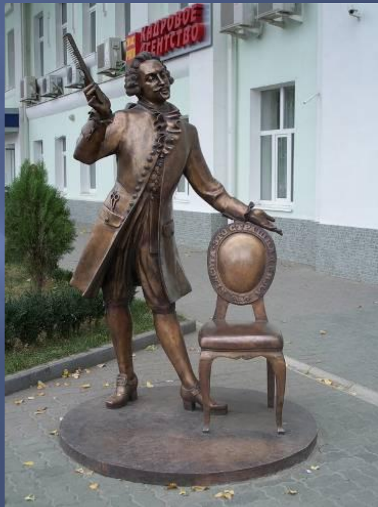
г. Ростов –на- Дону