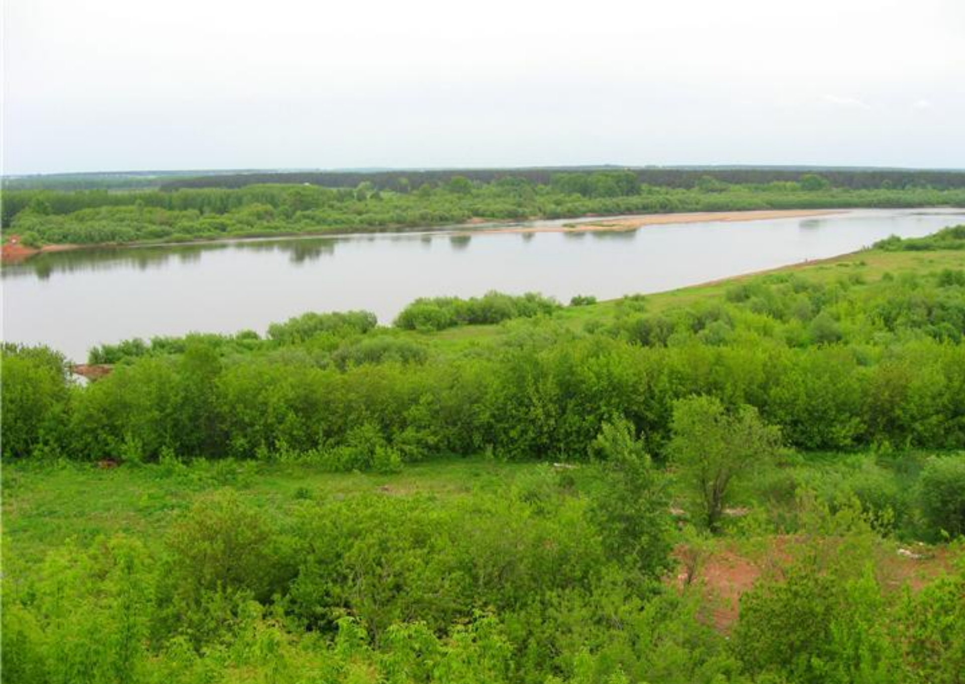
Река Вятка. На том берегу располагалась раньше Дымковская слободка.