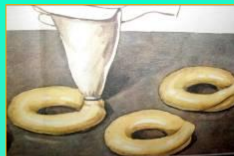
Круглые или овальные заготовки, d=12мм