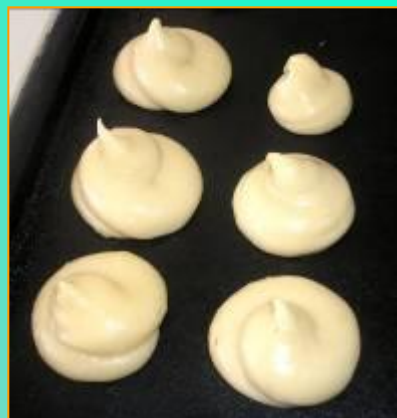
Круглые заготовки d=15см