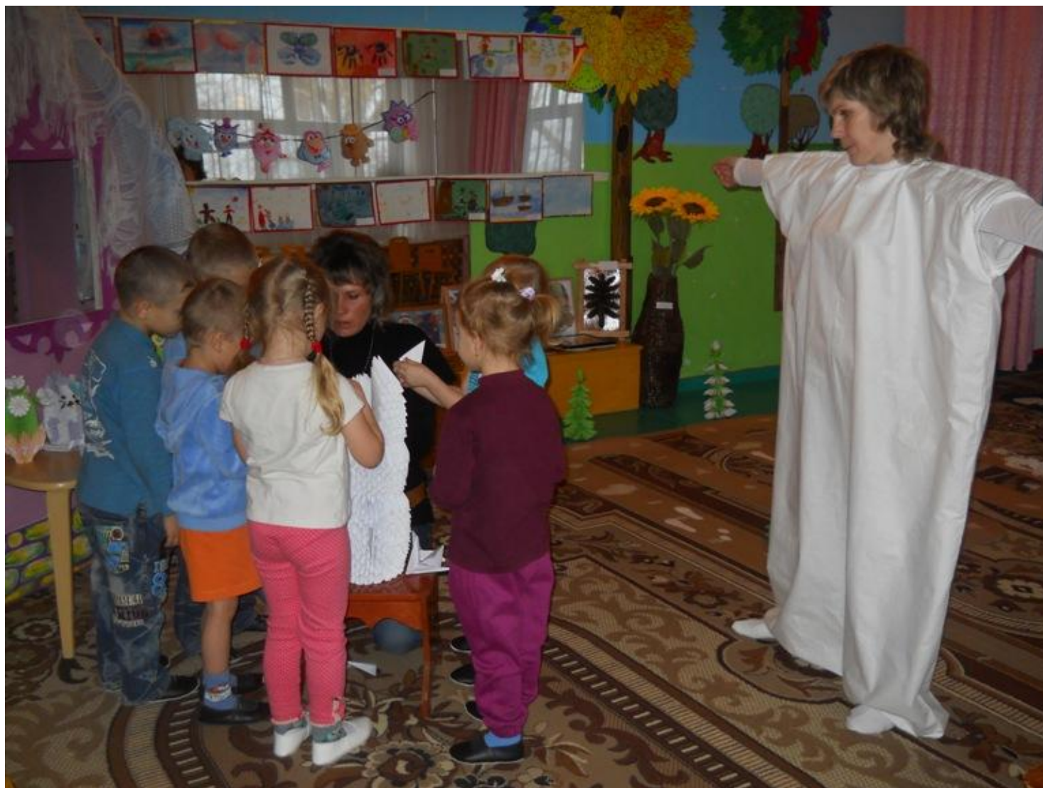
«Заключительный этап совместной продуктивной деятельности воспитателя с детьми модульное оригами «заяц»»