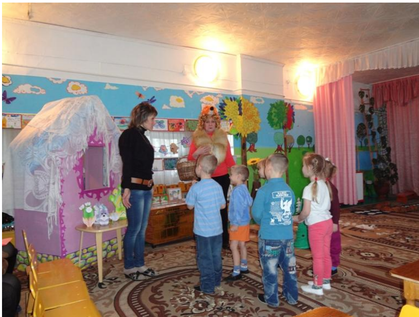
«Обсуждение подарка для зайчика»