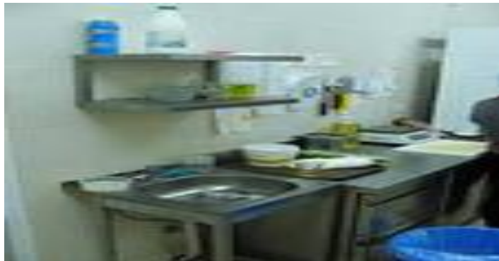
Мясо- рыбный цех