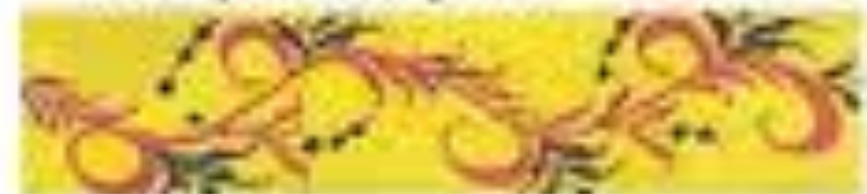
3 этап росписи- букет.

В основе травки лежит плавно изгибающийся стебель, от которого во все стороны отходят изогнутые стебельки. Они по всей длине усеяны большими и маленькими завитками, напоминающими узкие листочки.