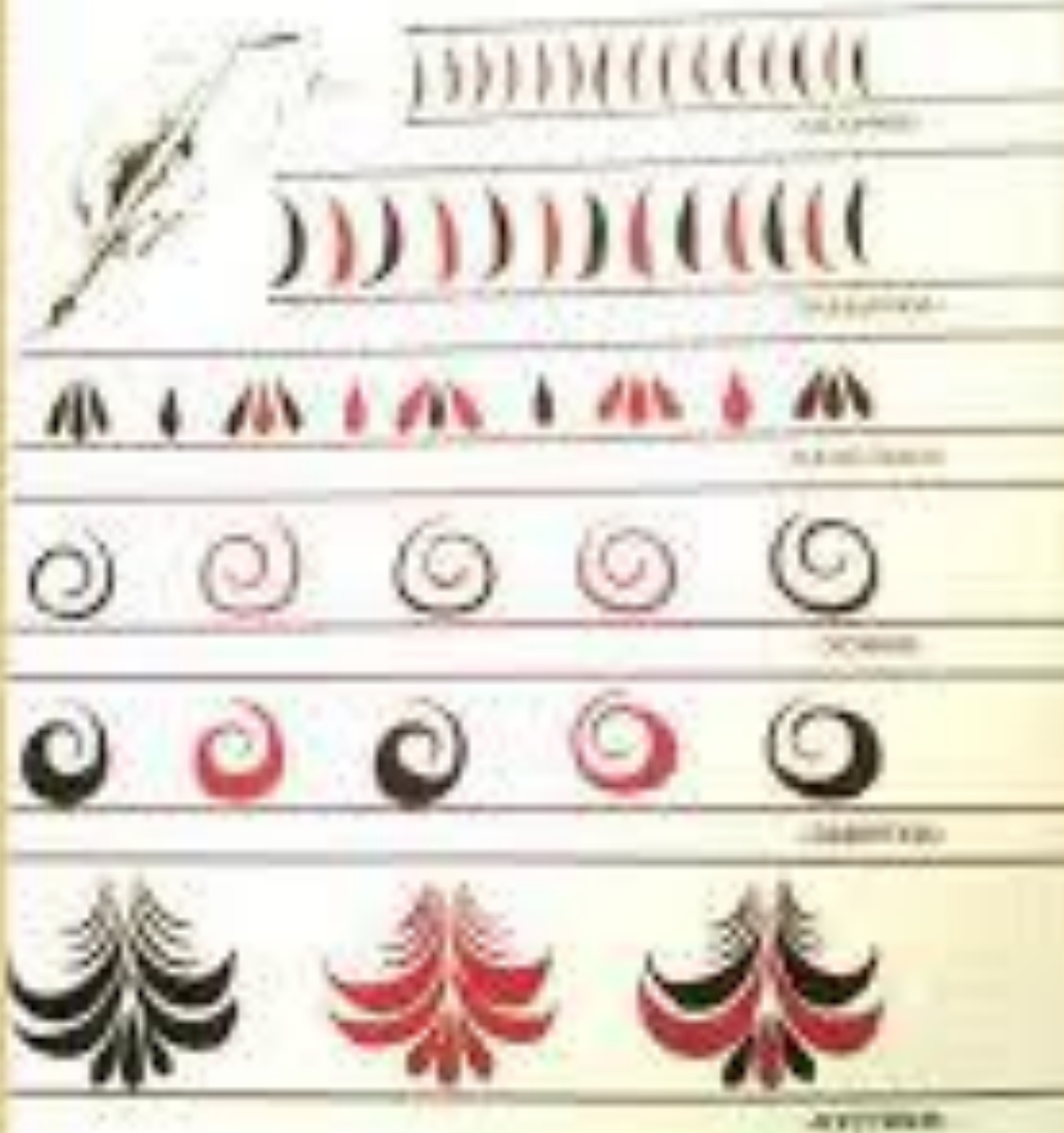
Узор - травка