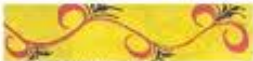
2 этап росписи- кусточки.