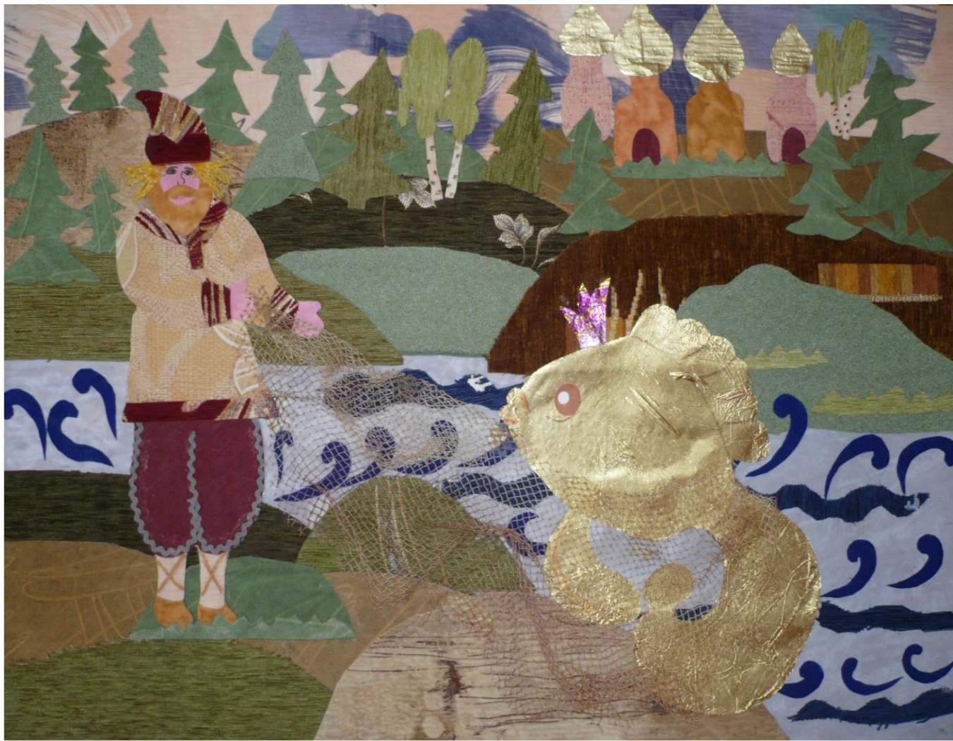
ПАННО «ЗОЛОТАЯ РЫБКА»