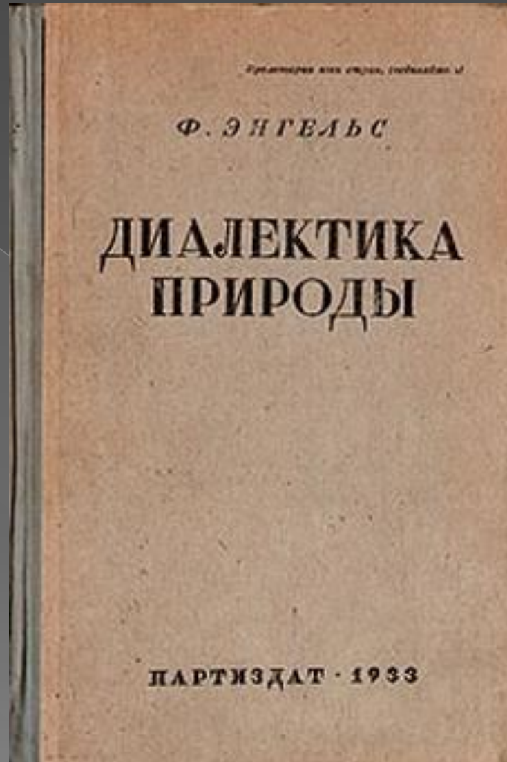
«Диалектика природы» Ф. Энгельса;