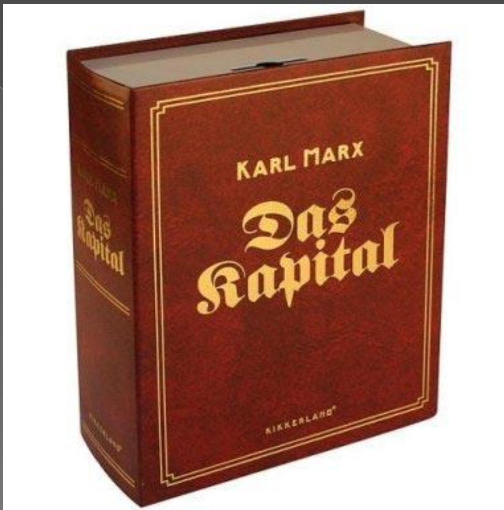
«Капитал» К. Маркса;