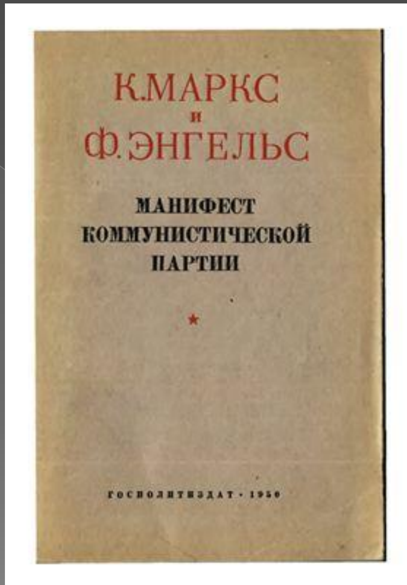
«Манифест Коммунистической партии» К. Маркса и Ф. Энгельса;