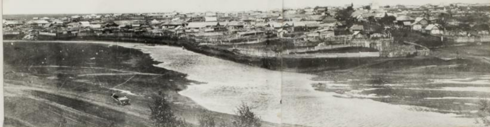
Село Щеглово в 1913 г., ставшее городом Щегловском в 1918 г. и городом Кемерово в 1932 г.