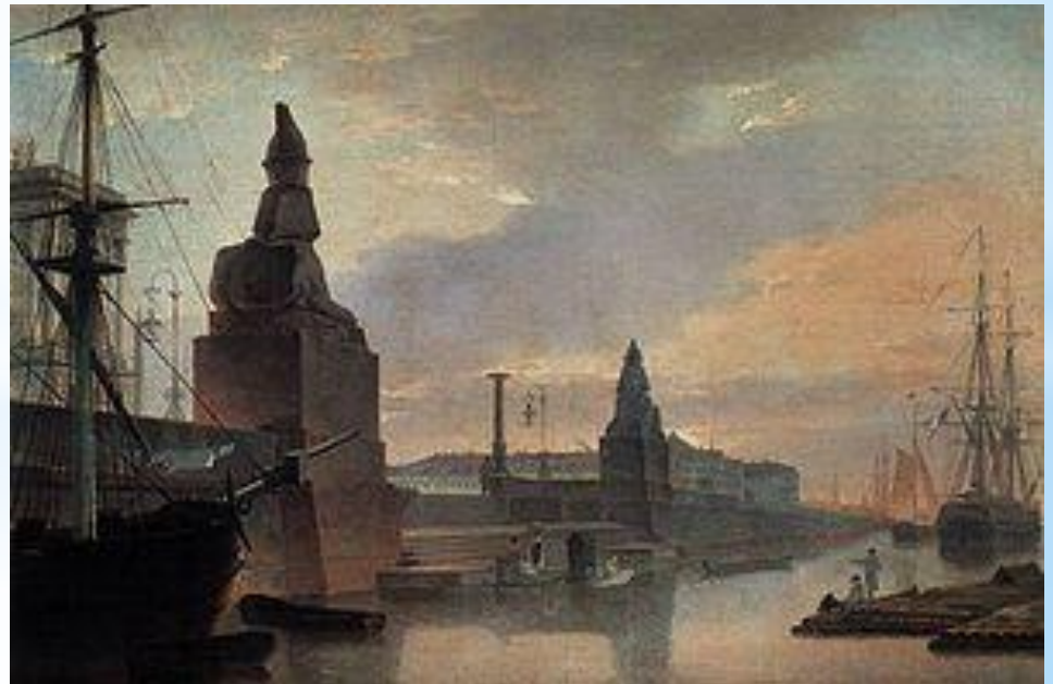
Университетская пристань в 1835 году