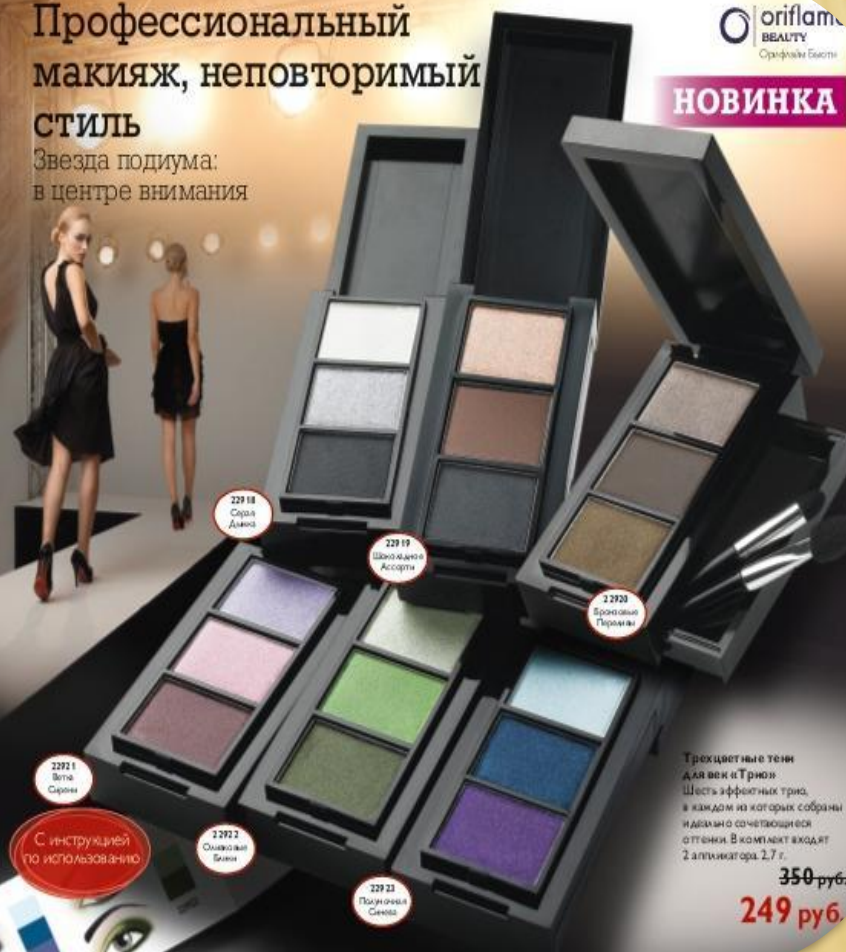
229 18 Сирень Лаванд