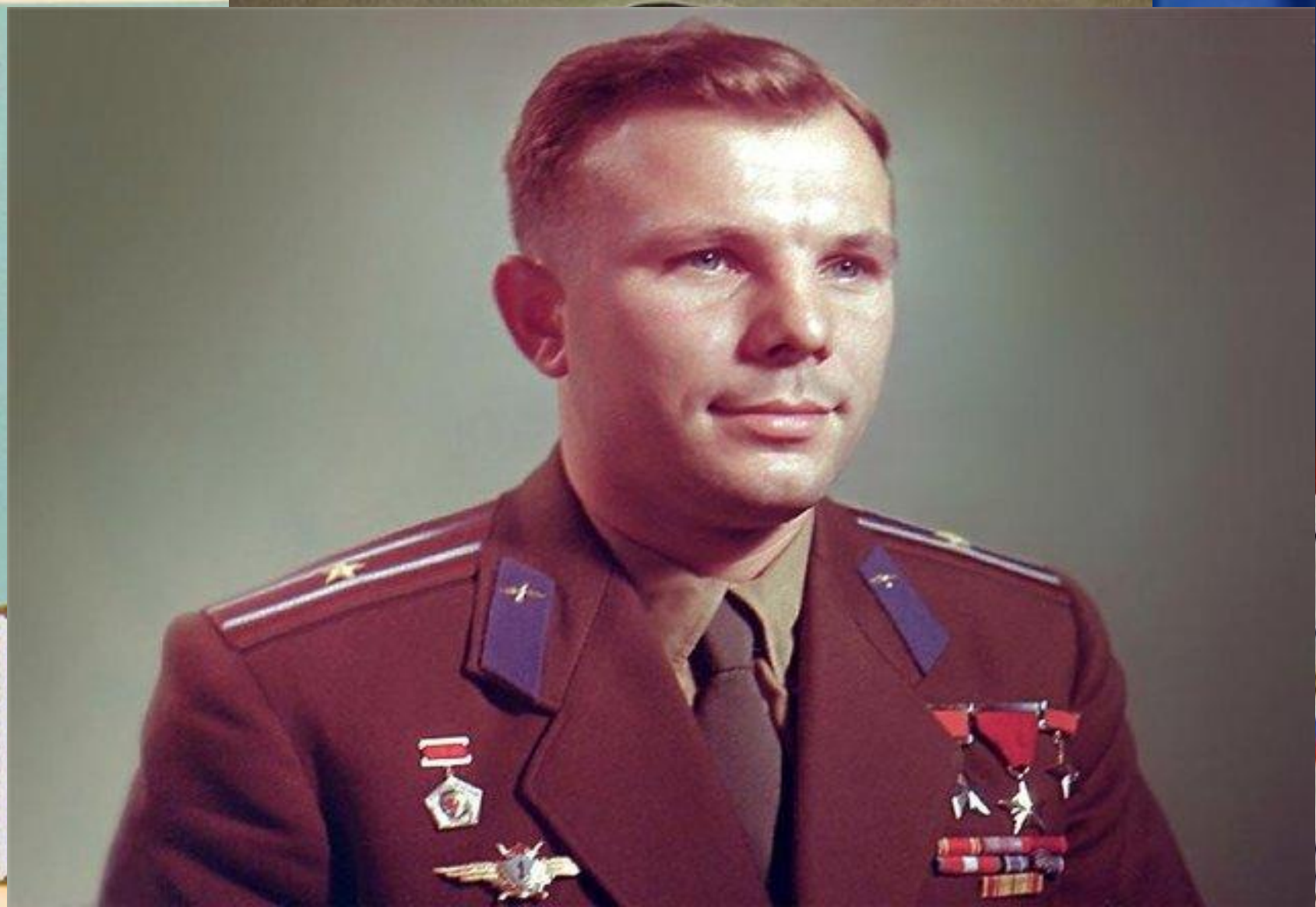
Гражданин Союза командир корабля «Союз», д.т.ч.и.д.у.с.р.наут подполковник Борис Валентинович ВОЛЬНОВ.