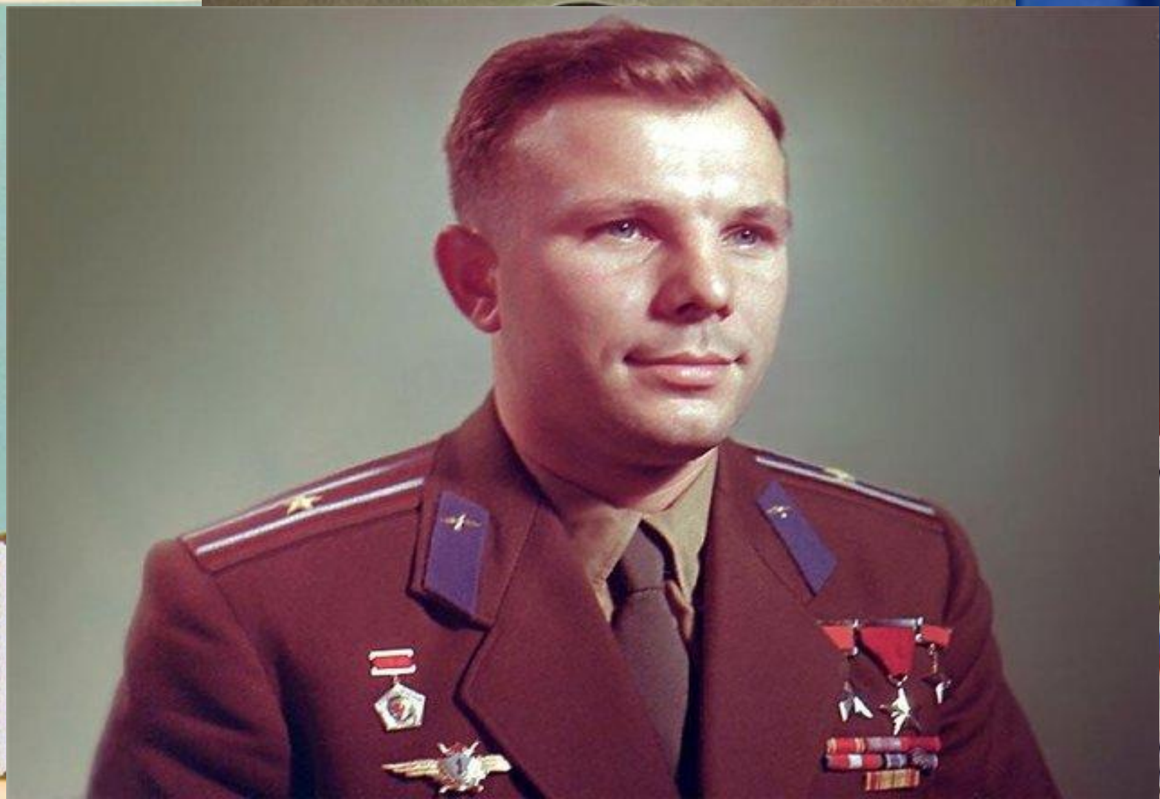
Гражданин Союза командир корабля «Союз», дивизионный командир подполковник Борис Валентинович ВОЛЬНОВ.