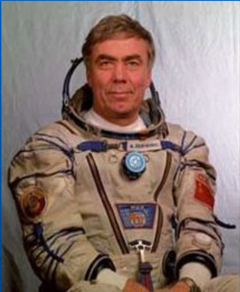
Левченко Анатолий Семенович (Харьковская обл.), советский космонавт, Герой Советского Союза