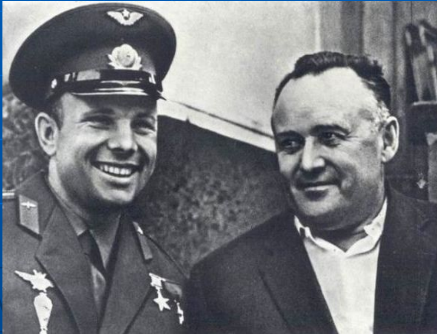
Ю. А. Гагарин и С. П. Королев