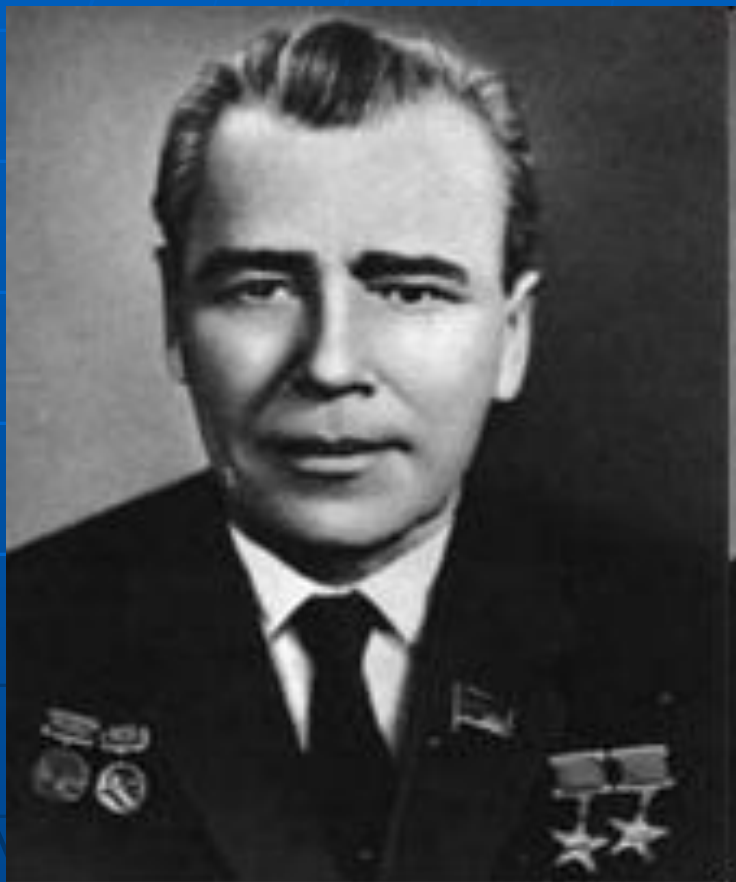
М. К. Янгель