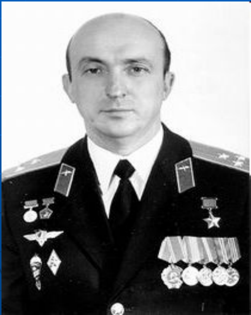
Васютин Владимир Владимирович, Лётчик-космонавт СССР, генерал- лейтенант, Герой Советского Союза.