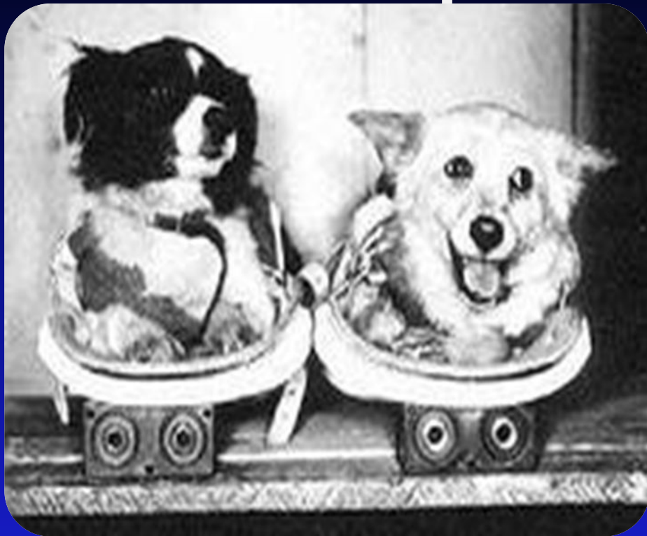
ЦЫГАН и ДЕЗИК