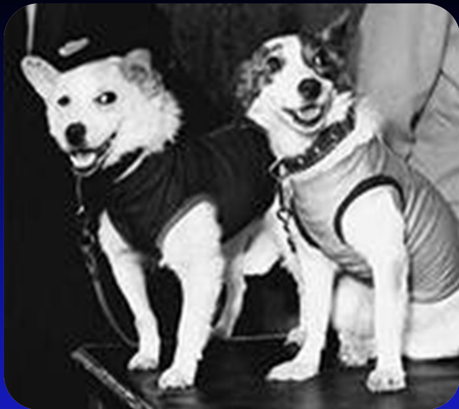
БЕЛКА и СТРЕЛКА