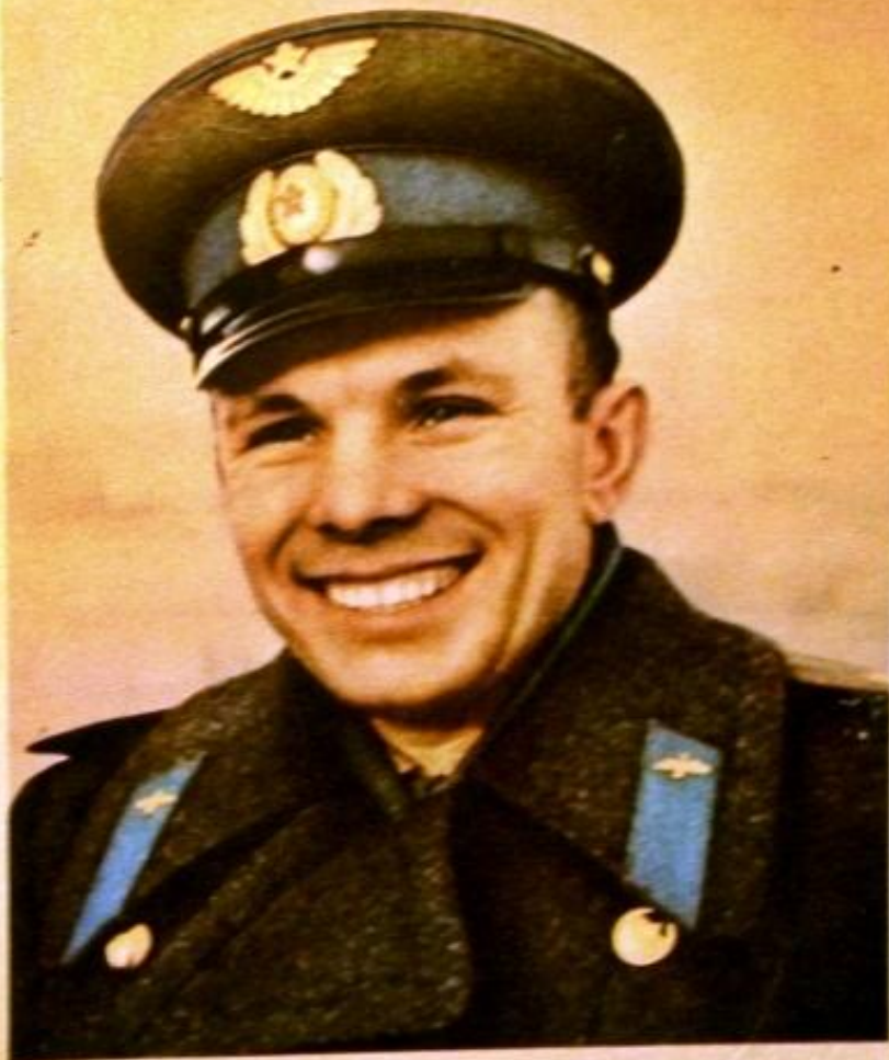
Первый человек, проникший в космос,— гражданин Союза Советских Социалистических Республик Герой Советского Союза летчик-космонавт СССР Юрий Алексеевич ГАГАРИН.