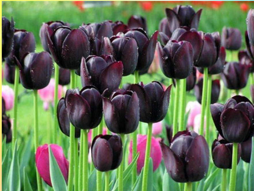
тюльпан Черный принц

Названия видов и сортов растений, овощей, фруктов, цветов в специальной литературе пишутся с прописной буквы, например: крыжовник Слава Никольская, морковь Нантская, фиалка Пармская, пшеница Днепровская-521.