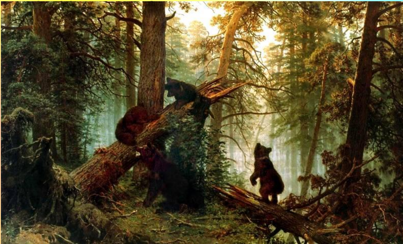
Шишкин. «Утро в сосновом лесу»

Если индивидуальные названия употребляются в качестве названий видов животных или в переносном смысле, то они пишутся со строчной буквы, например: мишки на картине Шишкина,