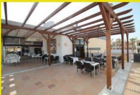
Пиццерия возле моря