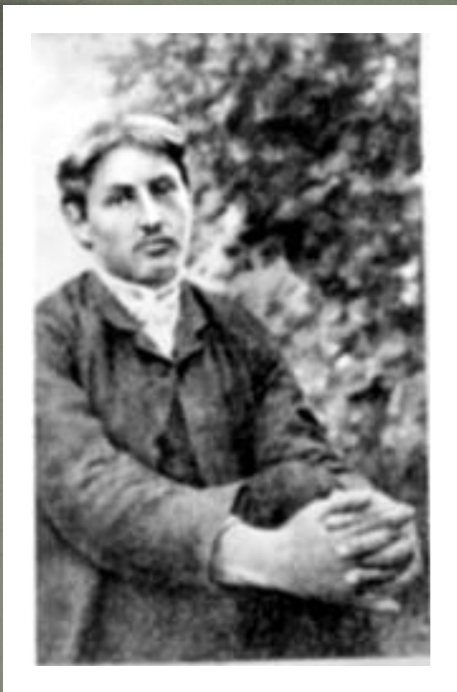
И.А. Бунин. 1888г.