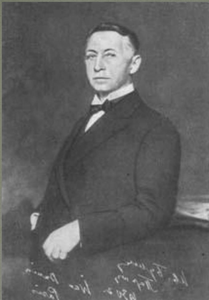
Бунин И. Париж, 1930 г.

С 1927 по 1939г И.А. Бунин работал над одной из лучших своих книг «Жизнь Арсеньева»