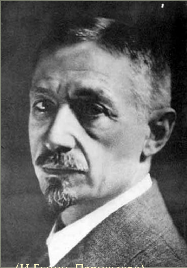
(И Бунин. Париж 1920)

Дневниковые записи, которые вел в 1918-1919гг были собраны им в книге «Окаянные дни»