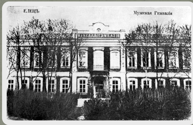
Гимназия, в которой учился Бунин в Ельце.