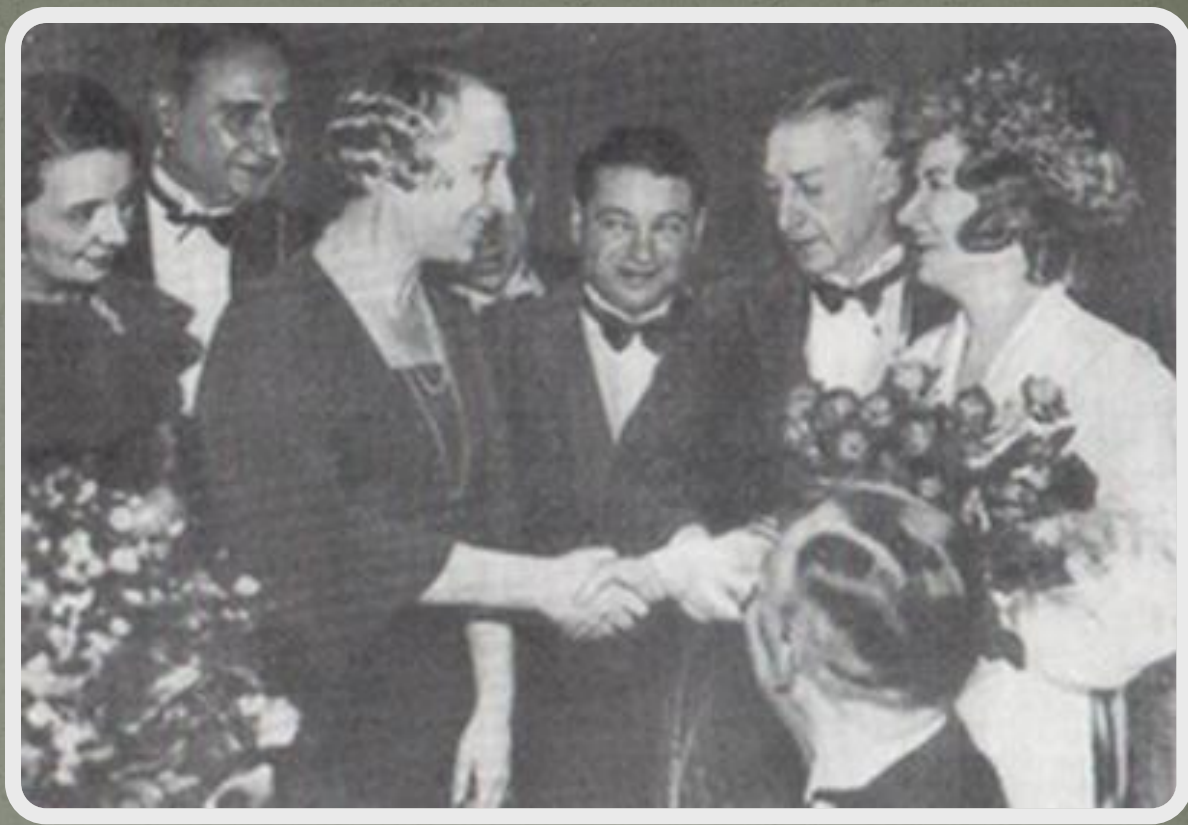
Чествование И.А. Бунина по поводу присуждения ему Нобелевской премии. Стокгольм. 1933 г.

1) В 1933 г Бунину была присуждена Нобелевская премия по литературе «за строгое мастерство, с которым он развивает традиции классической прозы» (И.Бунин стал первым русским писателем, удостоенным Нобелевской премии )