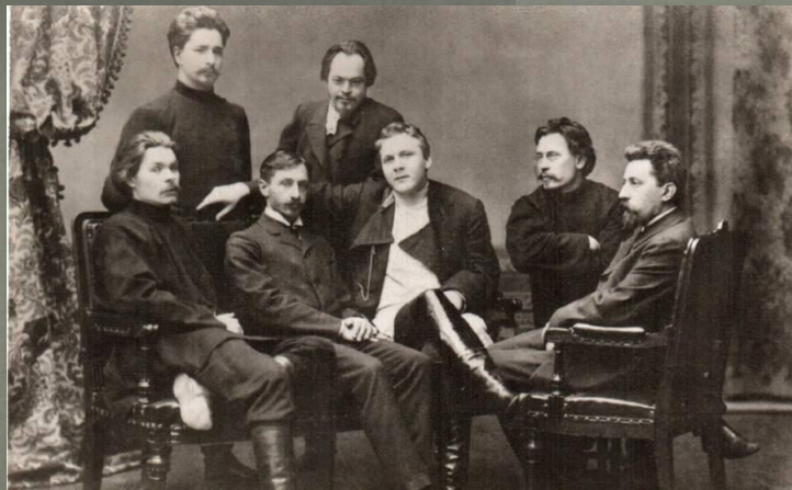
Члены московской литературной группы «Среды». 1902 г.

В начале 1895 в Петербурге, а затем и в Москве Бунин входит в литературную среду, знакомится с Чеховым, Н.К. Михайловским, сближается с В.Я.Брюсовым, К.Д. Бальмонтом, Ф.Сологубом.