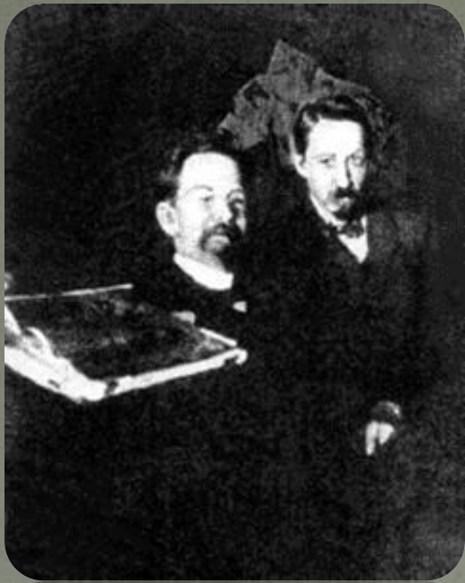
А.П. Чехов и И.А. Бунин. 1902 (1903г)

В начале 1895 в Петербурге, а затем и в Москве Бунин входит в литературную среду, знакомится с Чеховым, Н.К. Михайловским, сближается с В.Я.Брюсовым, К.Д. Бальмонтом, Ф.Сологубом.