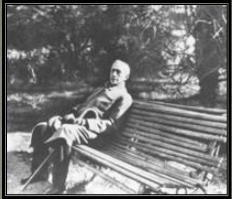
И.Бунин. Последние годы жизни.

Бунин умер в ночь на 8 ноября 1953 года. Похоронен на русском кладбище Сент-Женевьев-де- Буа под Парижем.