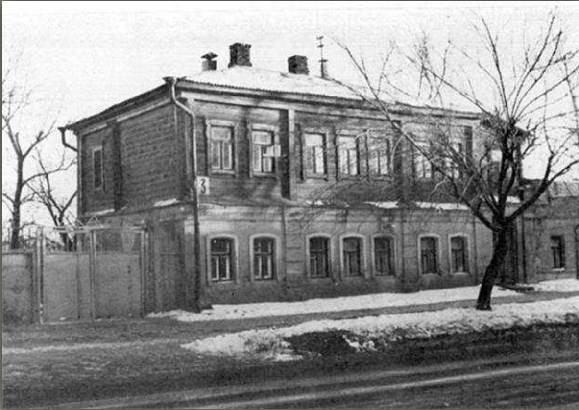
Дом, в котором родился И.А. Бунин. Воронеж.

Иван Бунин родился 10 (22) октября 1870 года в Воронеже, где прожил первые три года своей жизни. В дальнейшем семья переехала в имение Озерки под Елец, (Орловская губерния, ныне Липецкая область).