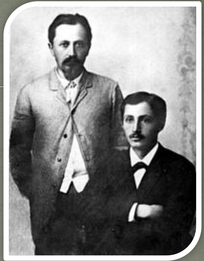
Ю.А. и И.А. Бунины. Полтава. 1891 г