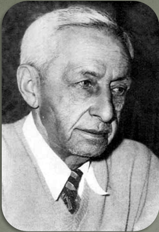
И. А. Бунин. Париж, 5 июля 1948