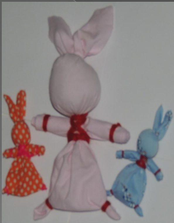
«Зайчик на пальчик»

Многие народные тряпичные куклы зачастую очень трудно отнести к какому то одному виду, одна кукла может относиться сразу к двум видам. Например "Зайчик на пальчик" обереговая и игровая кукла, "Зольная" кукла обрядовая и обереговая.