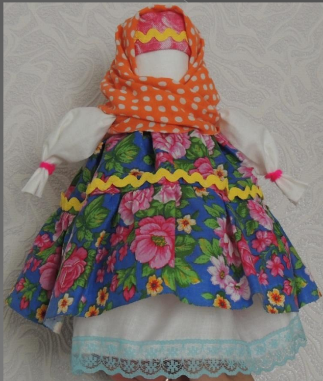
Кукла «Берегиня» Травница»

Другие называются куклы обереги, они оберегали жителей дома (домашних животных) от голода, от болезней, от плохих людей (обереги жилища, здоровья, детства)