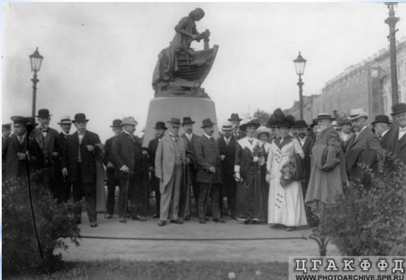
Открытие монумента на Адмиралтейской набережной состоялось 27 июня 1910 года.