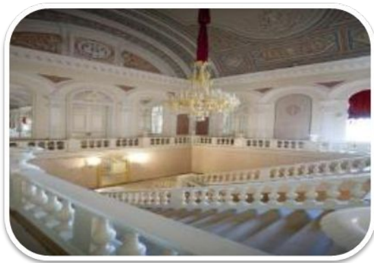
Лестница из главного вестибюля