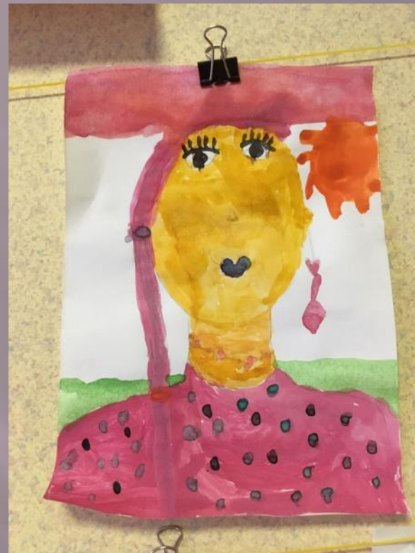
Это моя мамочка