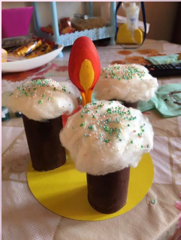
Наши семейные поделки на конкурс «Пасхальное чудо»