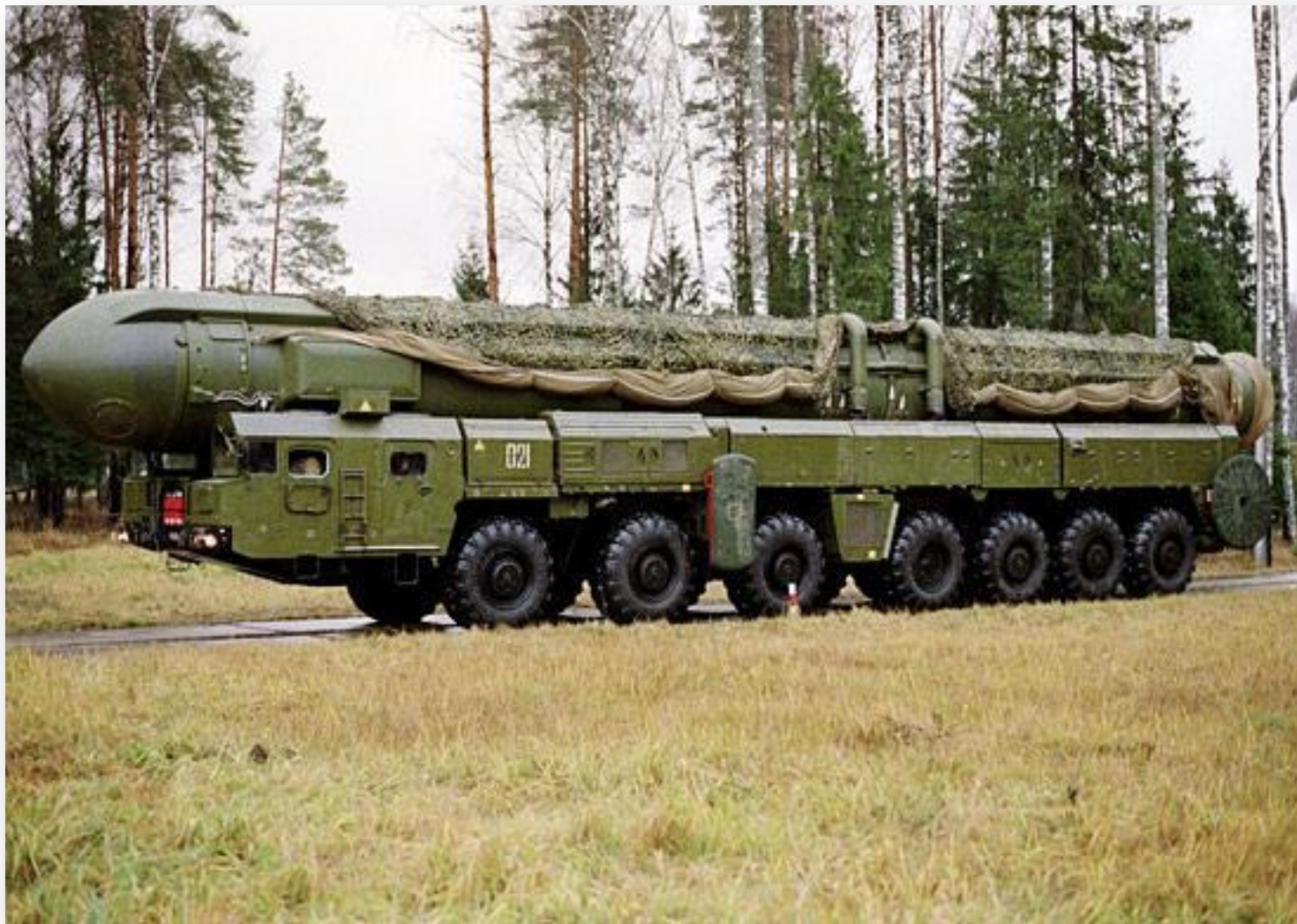
Машина боевого управления