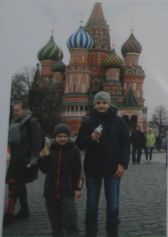
Это Храм Василия Блаженного.