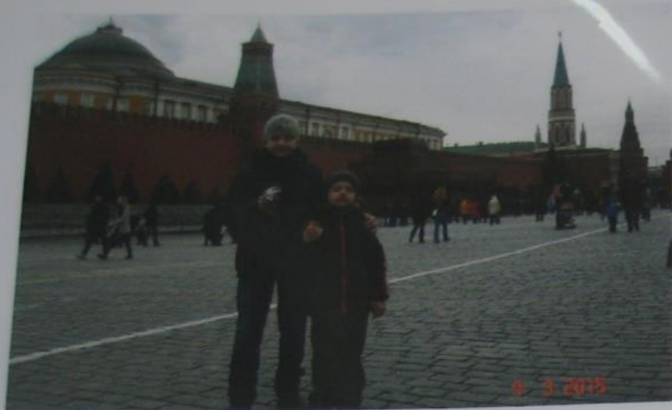
В выходные я со своей семьей был на Красной площади.