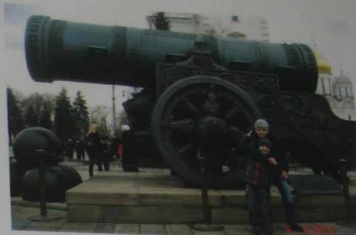
Это ЦАРЬ-ПУШКА. Вес каменного ядра Царь-пушки составляет около 819 кг.