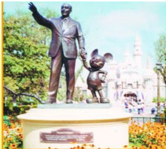
Памятник Уолт Диснею

Уолт Дисней - художник, создатель мультфильмов и киностудии Диснейлэнд