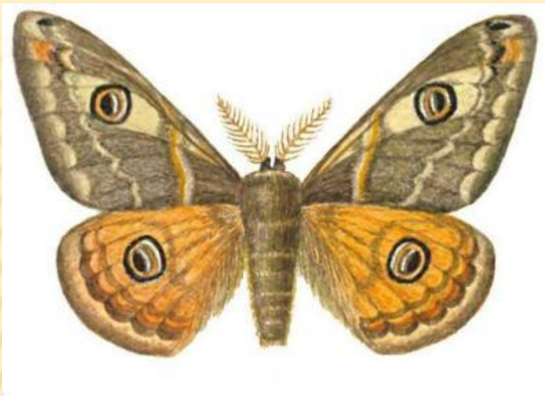
Павлиний глаз малый ночной