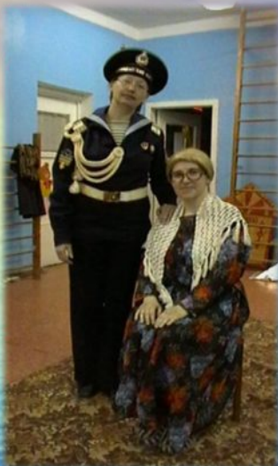
Праздник посвящённый Дню Победы

Последнее занятие модуля становится заключительным и должно быть очень интересным. Оно подводит итог проделанной работы и проводится не форме опроса, а в виде праздника, игры, конкурса, чаепития, бала - того дела, ради которого задумывался сюжет модуля.