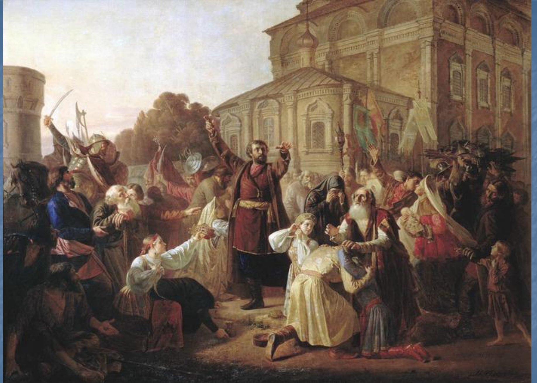
■ М.Песков. "Воззвание Минина к нижегородцам в 1611 году".