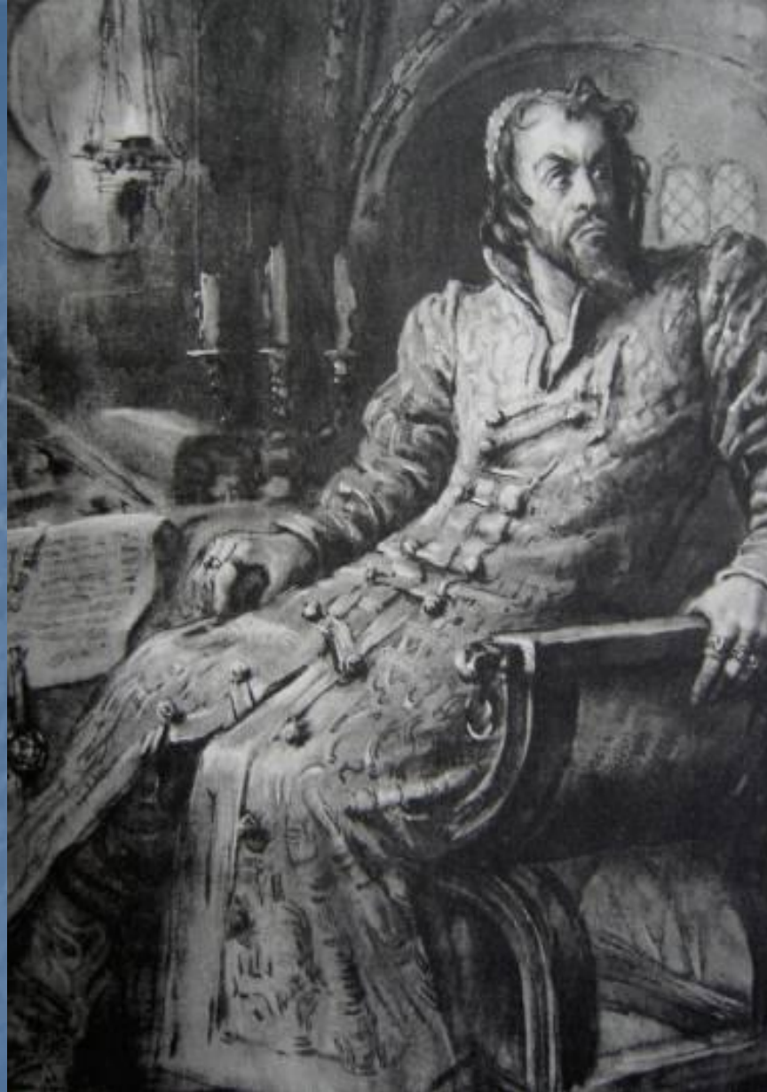
■ П.П.Соколов-Скала. "Борис Годунов" ■