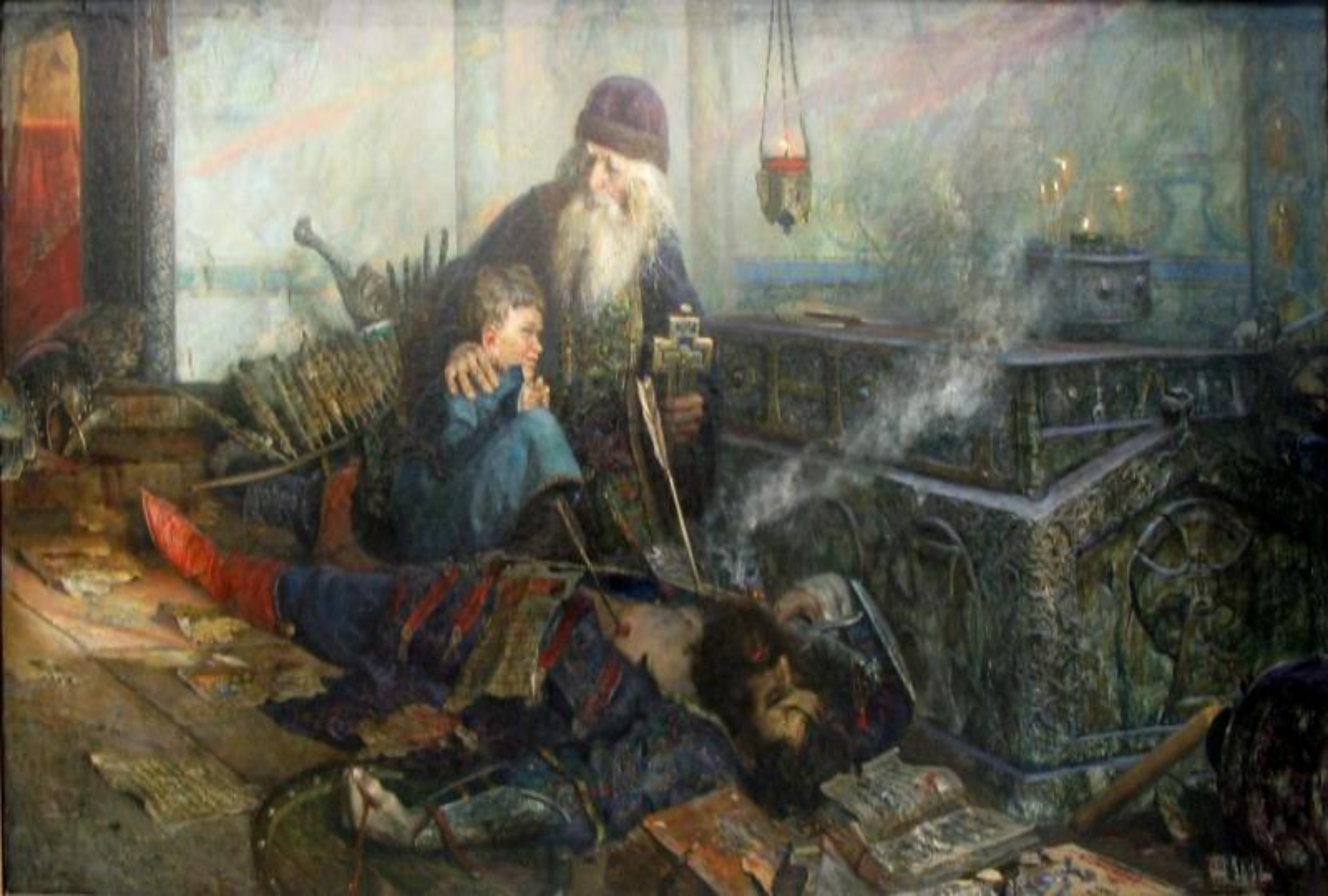
■ П.Рыженко. "Смутное время".