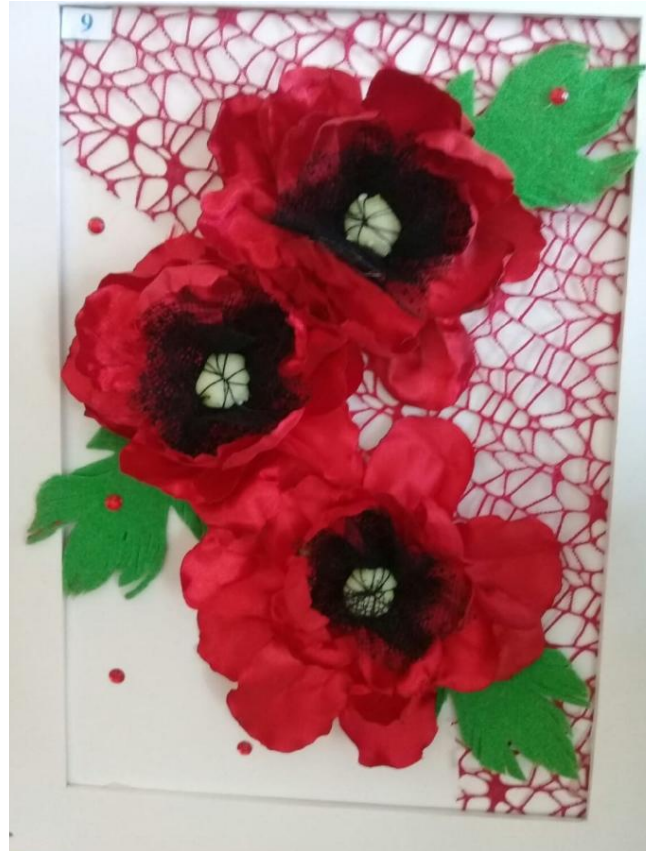
Эти панно выполнены из атласных лент