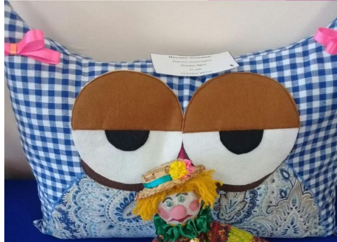
Это подушка – «Совушка»