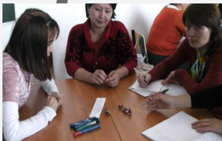
кәсіби білімін тереңірек дамытып, жетілдіру