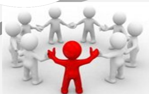
Коучинг - әріптестердің құпия, белсенді, жасампаз өзара әрекеттестік үдеріс