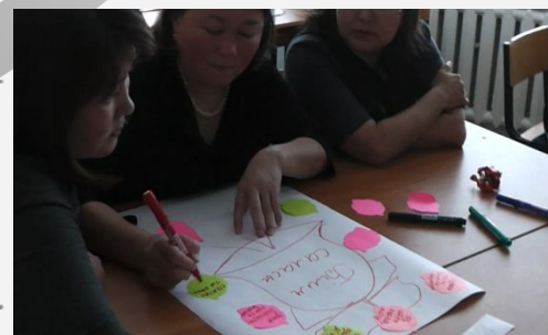
шешім қабылдау мақсатында, игерген дағдылары мен тәжірибесін жетілдіреді