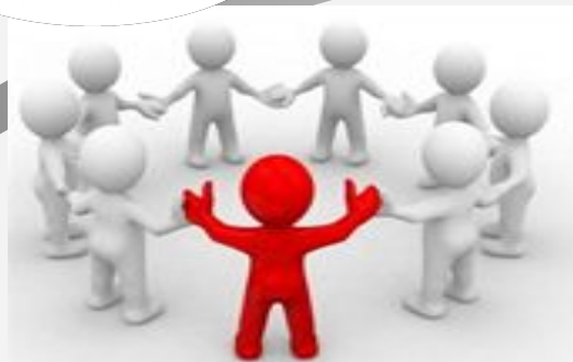
Коучинг - әріптестердің құпия, белсенді, жасампаз өзара әрекеттестік үдеріс