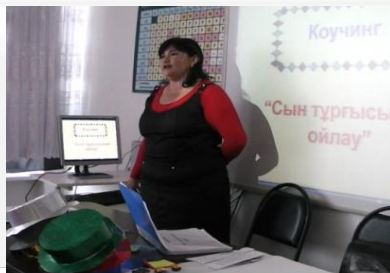
коуч тарапынан рефлексиялық диалогқа тарту