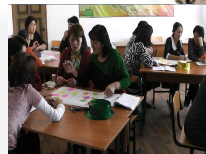
тәжірибелерін жоғары сапалық деңгейге көтеру