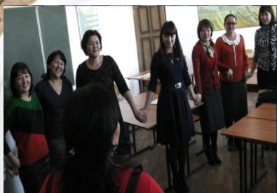
тәжірибенің жекелеген салаларын жетілдіру