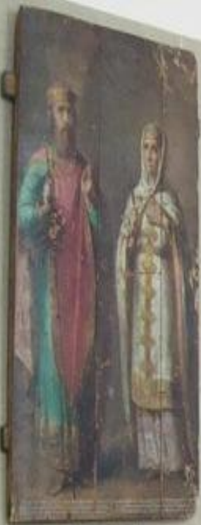
Святые Кирилл и Иованна