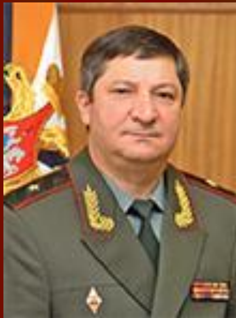
Генерал-майор Арсланов Халил Абдухалимович

Начальник Главного управления Связи Вооруженных Сил Российской Федерации — заместитель начальника Генерального штаба Вооруженных Сил Российской Федерации с декабря 2013 г. по настоящее время (04.04.1964 г. р.)