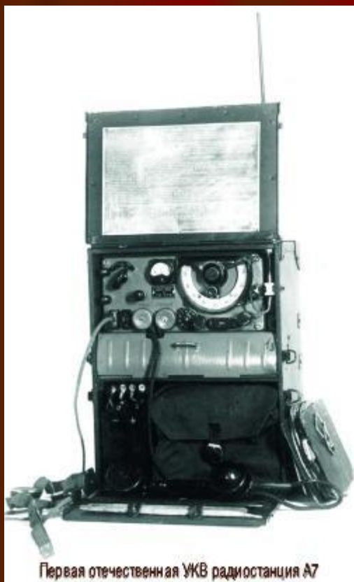
Первая отечественная УКВ радиостанция А7

В 1942 году была разработана первая переносная отечественная УКВ радиостанция А-7 с частотной модуляцией для стрелковых и артиллерийских полков, которая получила очень высокую оценку в войсках