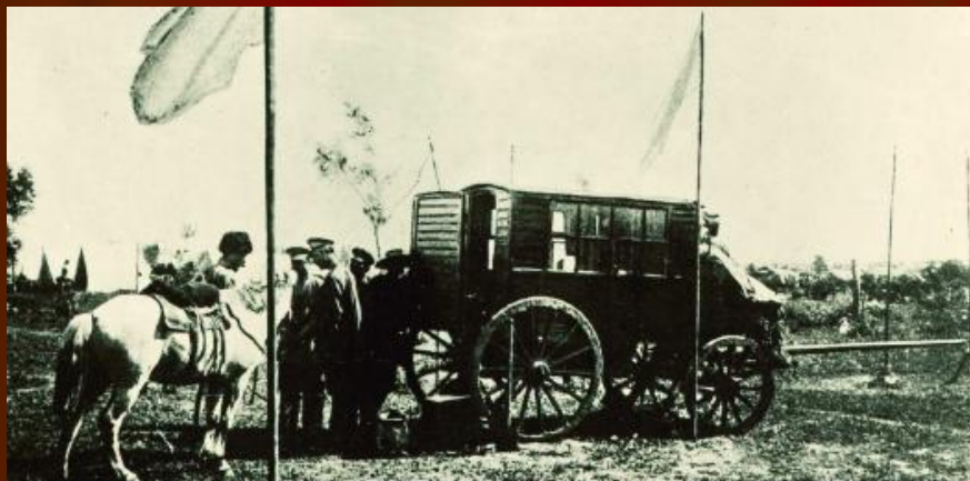
Станция полевого телеграфа

В 1695 г. при походе Петра I на турецкую крепость Азов впервые была организована почтовая связь с Москвой (письма и посылки доставлялись за 10—12 дней).