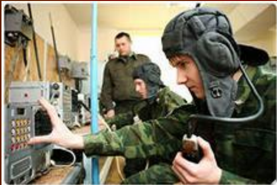
Будни военных связистов

Приказом Реввоенсовета республики от 20 октября 1919 года № 1736/362 было образовано Управление связи Красной Армии во главе с начальником связи Красной Армии, а также управления связи фронтов и армий, отделы связи в дивизиях и бригадах.