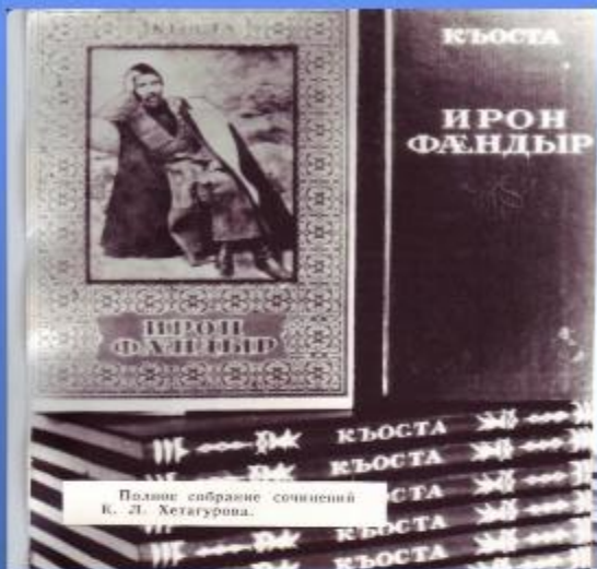
Полное собрание сочинений К. Л. Хетагурова.