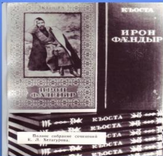
Полное собрание сочинений К. Л. Хетагурова.