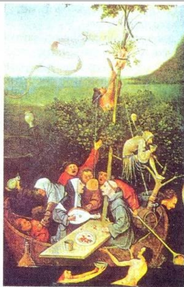
▲ И. Босх. Корабль дураков. XV в.