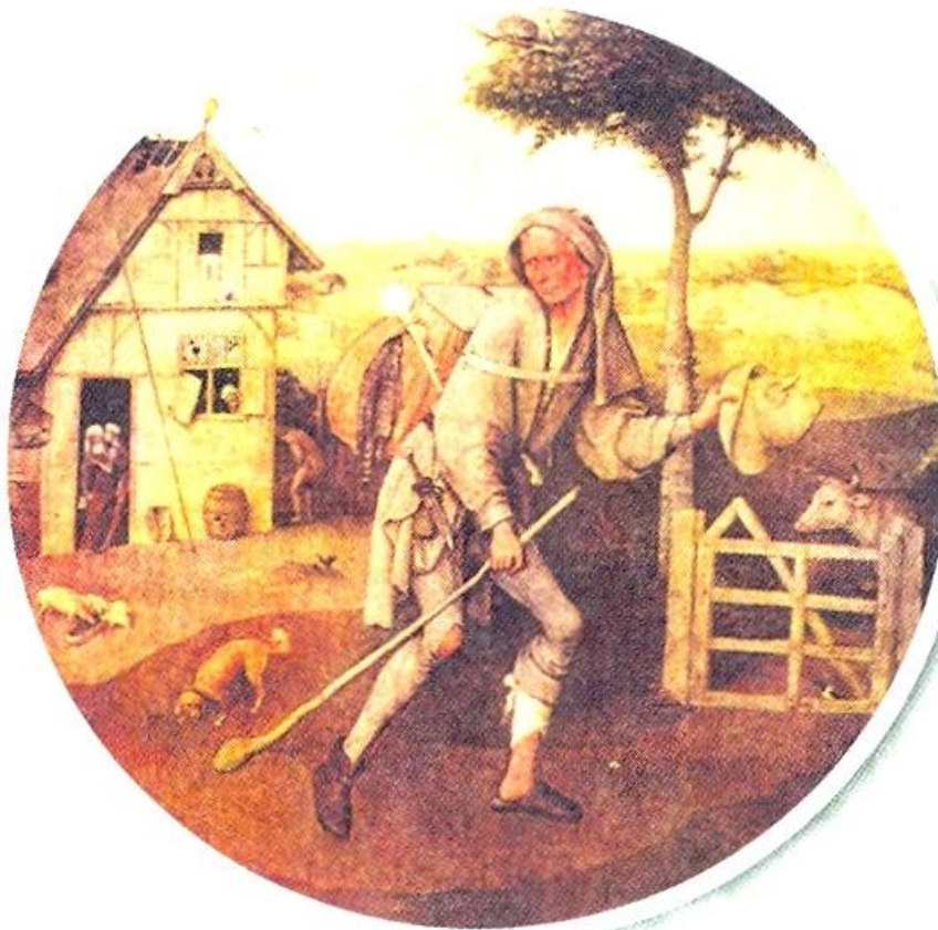
▲ П. Брейгель Старший (Мужицкий). Бродяга. XVI в.