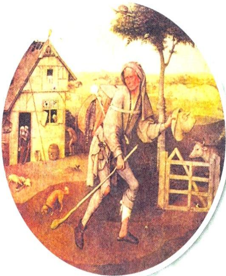
▲ П. Брейгель Старший (Мужицкий). Бродяга. XVI в.