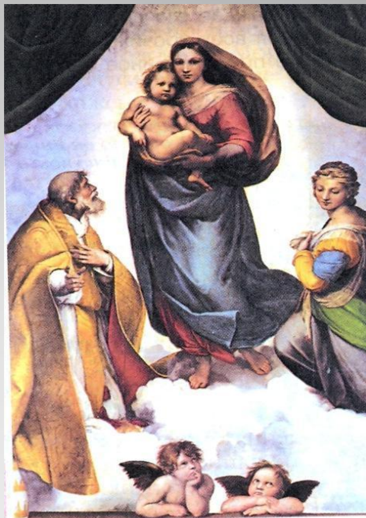
▲ Рафаэль. Сикстинская мадонна. 1513 – 1514.