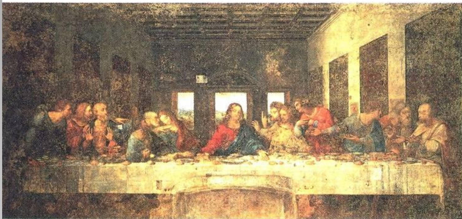
▲ Леонардо да Винчи. Тайная вечеря. 1497.