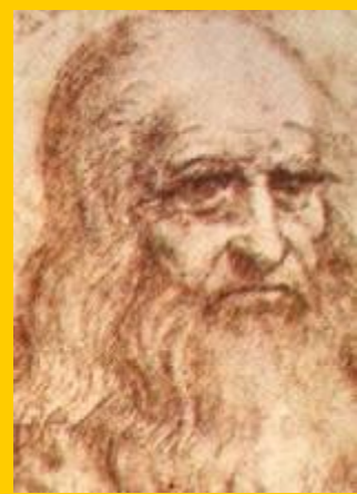
ЛЕОНАРДО – ДА - ВИНЧИ