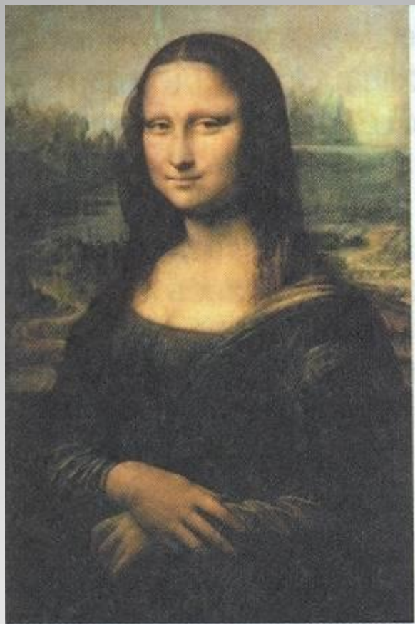
▲ Леонардо да Винчи. Портрет Моны Лизы. (Джоконда.) 1503.