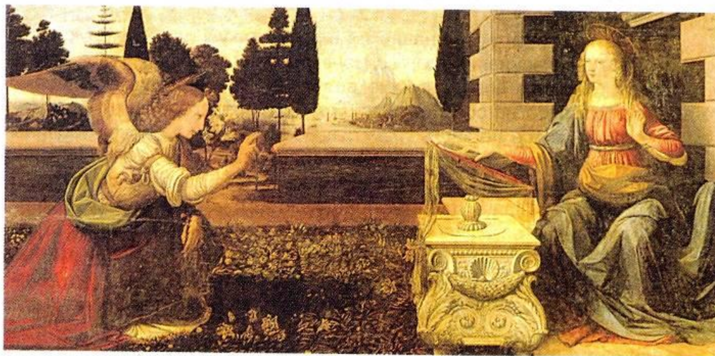
▲ Леонардо да Винчи. Благовещение. Ок. 1475.