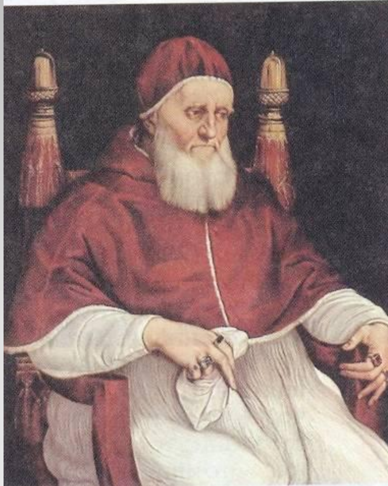
Рафаэль. Папа Юлий II. 1512.