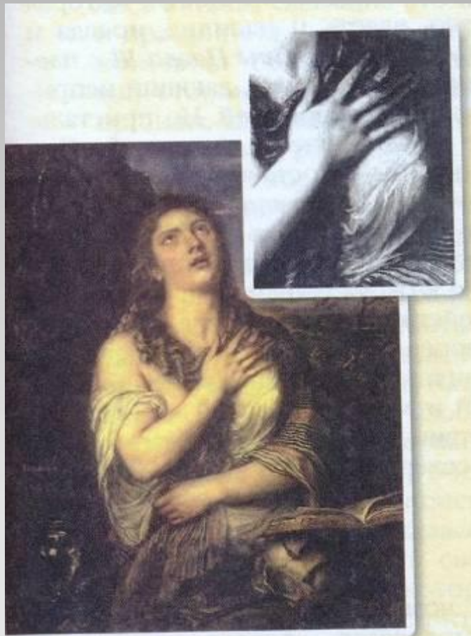
▲ Тициан. Кающаяся Мария Магдалина. Первая половина 1560-х гг.