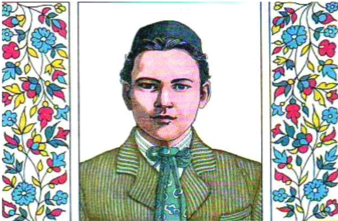
Габдулла Тукай ( 1886-1913 )