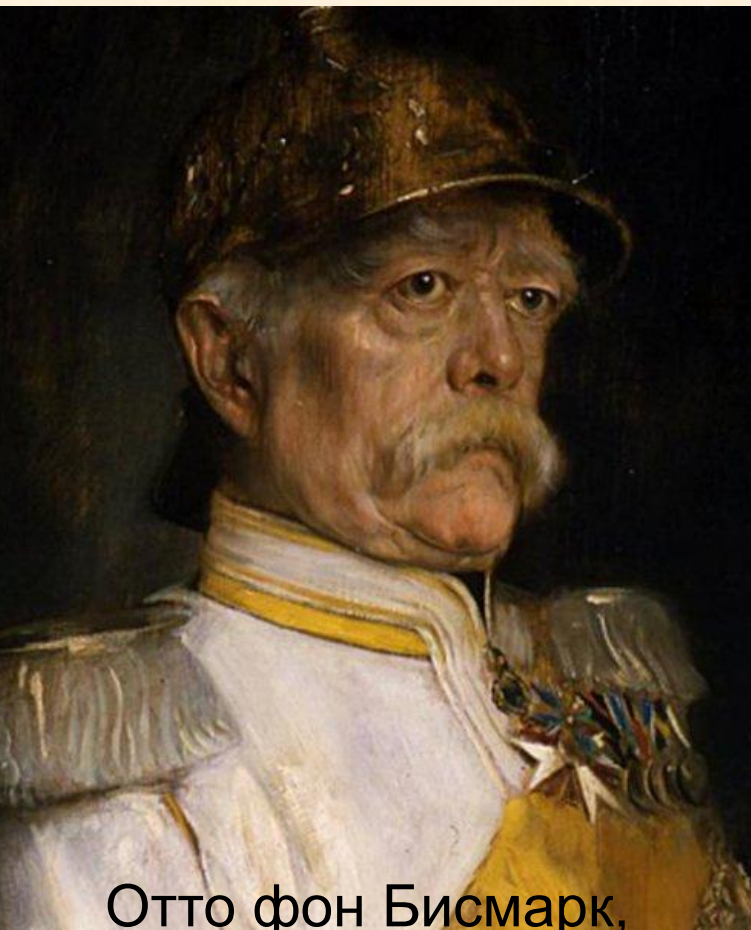
Отто фон Бисмарк, автор пенсионной реформы в Германии